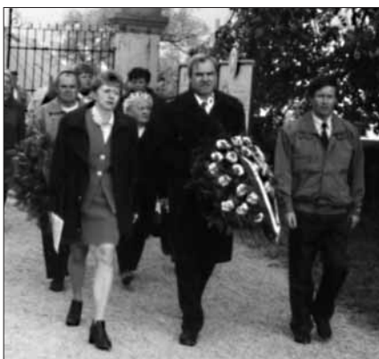
Zástupci města uctili památku padlých sovětských vojáků.

My, členové základní organizace Českého svazu bojovníků za svobodu ve Slavkově, jsme velmi potěšeni, že představitelé města nezapomínají na historické události v dějinách naší vlasti a jsou důstojnými pokračovateli v uctívá-