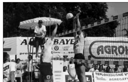
Utkání v plážovém volejbalu.