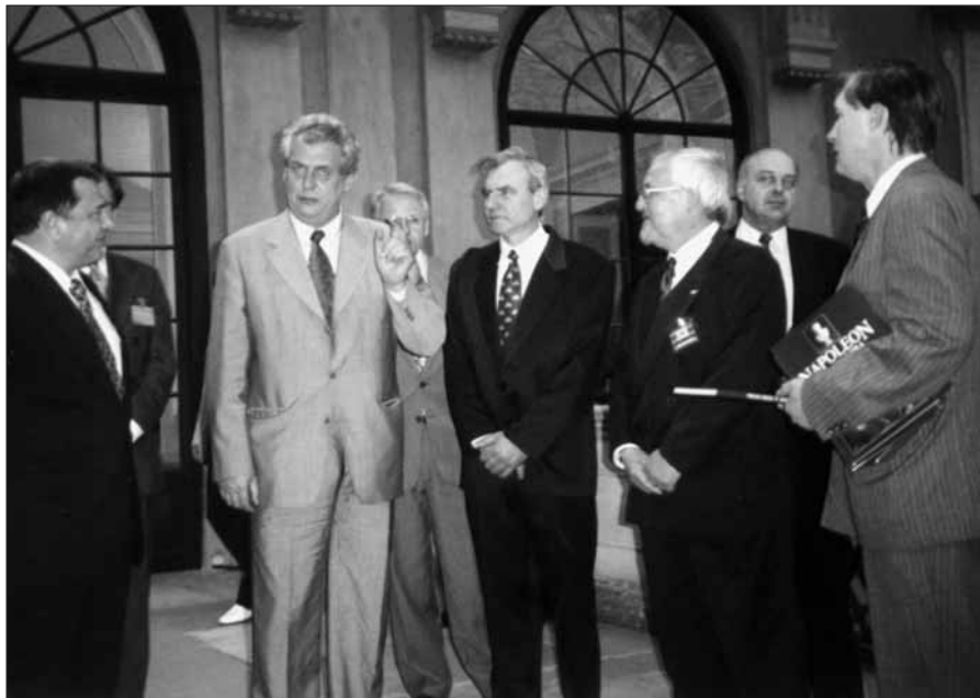
Předseda vlády ČR Miloš Zeman při návštěvě Slavkova 4. května. (Článek Ministři navštívili Slavkov na straně 3.)