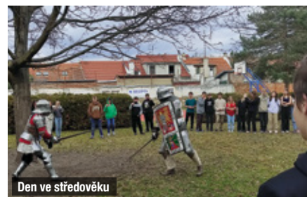
Den ve středověku