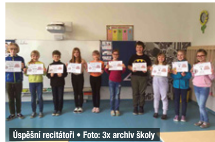
Úspěšní recitátoři • Foto: 3x archiv školy