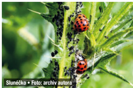
Sluněčko