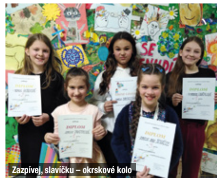
Zapívej, slavičku – okrskové kolo