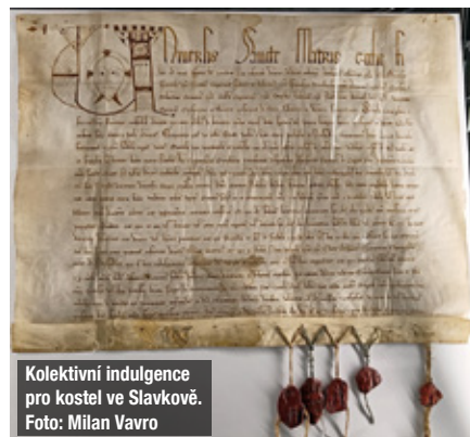
Kolektivní indulgence pro kostel ve Slavkově.