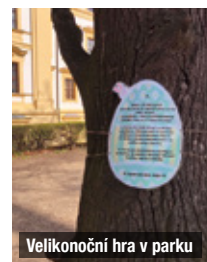
Velikonoční hra v parku