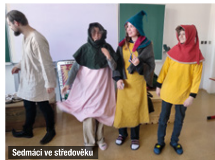
Sedmáci ve středověku

největší ohlas měla ukázka souboje na školním dvoře.