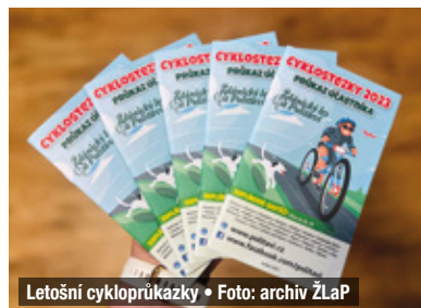
Letošní cykloprůkazky

kazce“. „Cykloprůkazku“ najdete například i v turistickém informačním centru ve Slavkově u Brna a nálepku hledejte rovněž v jeho okolí. ŽLaP