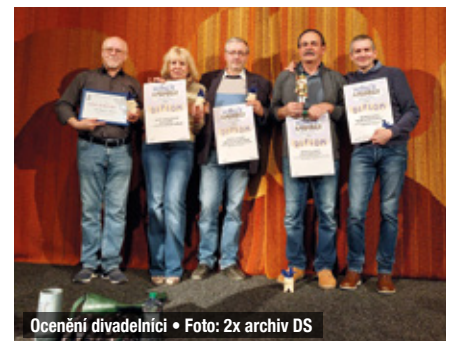
Ocenění divadelníci • Foto: 2x archiv DS