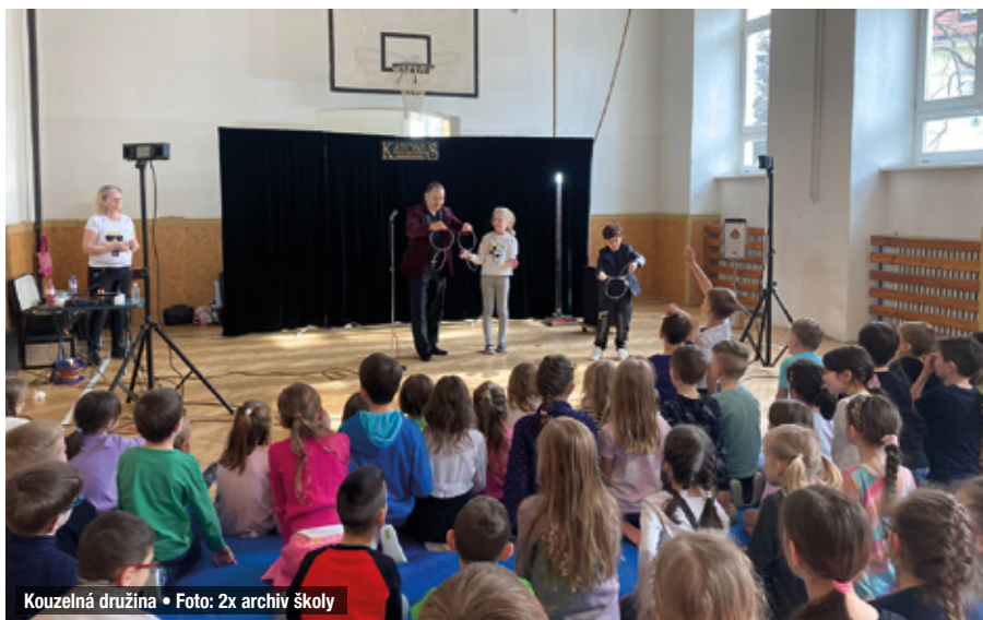
Kouzelná družina