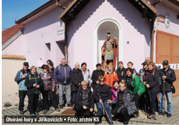
Otvírání hory v Jiřikovcích