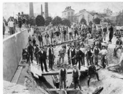
Jsou ještě pamětníci stavby prvního řepného kanálu u cukrovaru. Našlo by se dnes tolik zdatných pracovníků?

Dnes výhoda položení cukrovaru na železniční vlečce ve stanici ČSD Slavkov je využívána pro předzásobení tuhými palivy a vápence. Doprava řepy v kampani je zajišťována auty a vlekly. A že to není malý úkol vidíme z toho, že denně cukrovar zpracuje 110—120 vagonů řepy. Aby bylo dosaženo tak vysoké kapacity, bylo nutno několikrát zařízení modernizovat. V posledních letech investice na modernizaci zařízení činily přes 100 miliónů Kčs. V příštích letech, kdy technický rozvoj zasáhne i do tohoto odvětví, to bude několikrát více. Při-