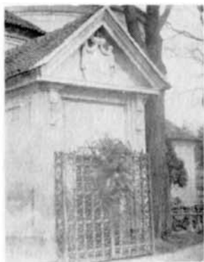
Hrobka Kauniců na slavkovském hřbitově

Sledoval pilně přípravy pro stavbu kolejí a staral se nejen o finanční zajištění, ale i obsahovou a architektonickou tvář. Žel dokončení stavby se nedočkal, zemřel 14. října 1913.