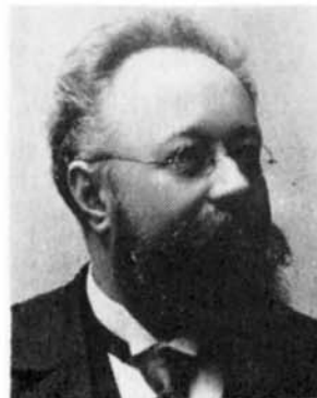
Václav hrabě Kaunic

26. září tomu bude 135 let co se dr. Václav Kaunic narodil. Ve čtyřech letech mu zemřel otec a jeho matka Eleonora Voračická jej, spolu s dalšími dětmi, vychovávala sama. Učila své děti lásce k českému národu, k jeho slavné minulosti, vedla je i k zájmu o tehdejší českou kulturu. V jejich pražském domě bývali častými hosty čeští národní buditelé. Nacházeli zde vzácné porozumění pro práci i materiální podporu. Např. Božena Němcová na důkaz vděčnosti věnovala v roce 1855 první vydání „Babičky“ této vzácné ženě.