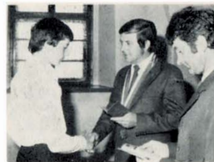
Důstojným způsobem jsou předávány první občanské legitimace nastupující generaci.

Na tomto úseku se dosáhlo výrazného zlepšení (např. budování a udržování předzahrádek, rozšiřování zeleně ve městě, údržba parků i komunikací i čištění veřejných prostranství). Čistota města je věcí každého občana, každého návštěvníka města, neboť 2 pracovníci na veškerý úklid stačit nemohou. MěNV usiluje o získání zametacího vozu, který by pomohl aspoň nejfrekventovanější části města zbavovat prachu a nečistoty. Větší důraz musí být kladen na závody a další socialistické organizace, aby plnily svůj úkol garantů čistoty města ve svém okolí. To nezabývá občany jejich občanských povinností podílet se na udržování čistoty města jak na dvorech, tak i před domy. Příkladem