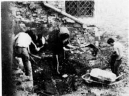
Účastníci mládežnické zahraniční brigády čistí u slavkovského zámku okapy.

Při besedě vyjádřili díky slavkovským občanům, neboť mohli využívat hřiště, důkladně si prohlédnout zámek, někteří si „zadovářili“ v dostihové stáji, navštívili hrobku Kauniců na místním hřbitově i muzeum, byli