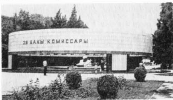
Památník 26 umučeným revolucionářům po anglické intervenci po VRSR v Baku.