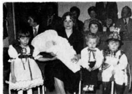
Z občanských obřadů je vítání občánků za účasti dětí jedním z nejkrásnějších.

13. schůze rady MěNV projednala současný stav bytové situace ve městě a konstatovala, že nedošlo k podstatným změnám a projednala opatření k zlepšení v dalším období. Dále projednala kontrolní činnost odborů MěNV a návrh plánu na II. pololetí 1983 a současně výsledky kontrolní činnosti komisí MěNV a práci VLK v I. pololetí i plán práce na II. po-