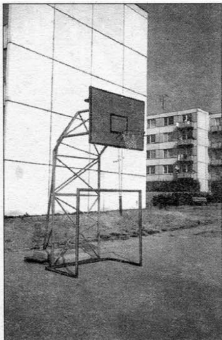
Nové hřiště mají děti mezi paneláky na Zlaté Hoře. Stačilo málo a kluci i dívky mají možnost využít svůj volný čas.