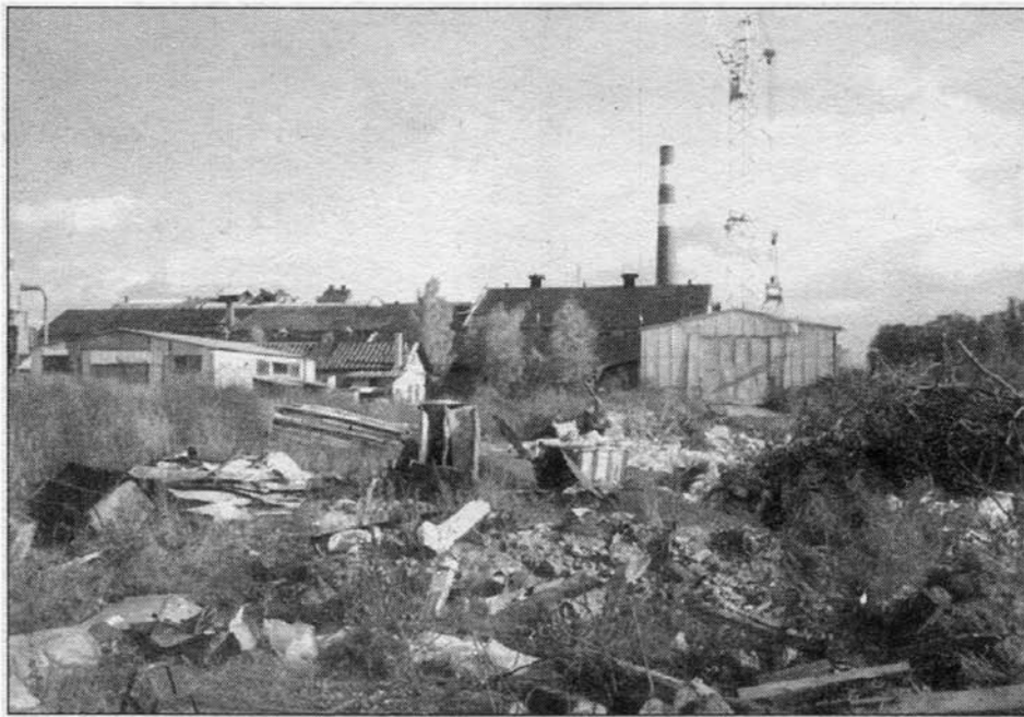
Takhle bychom si okolí našeho města jistě nepředstavovali. Bohužel, toto je realita v okolí bývalého cukrovaru.