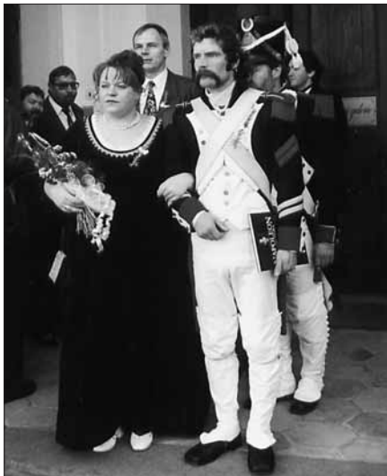
Svatba dvou německých nadšenců a příznivců napoleonské doby se uskutečnila poprvé v historii v zámecké kapli Sv. kříže ve Slavkově u Brna 2. prosince. Význam této události podtrhla i přítomnost slavkovské gardy v historických uniformách francouzské armády. Celá událost se odehrála za přítomnosti řady novinářů