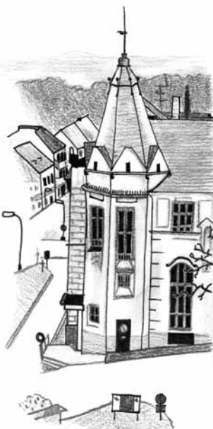
Kresba: žáci ZŠ Komenského