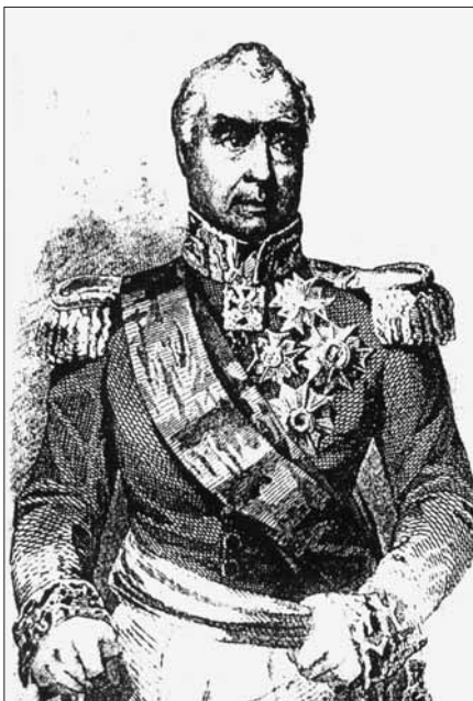
← Auguste Frédéric Louis Viesse de Marmont, francouzský generál

Historické podklady byly vyňaty z archivu města Zeist (redakčně kráceno)