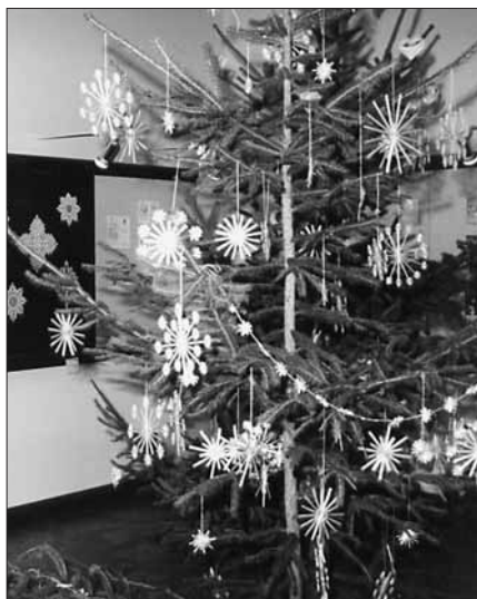
Výstava „Tradice české vánoční výzdoby“ v galerii OK potrvá až do 31. prosince 1999