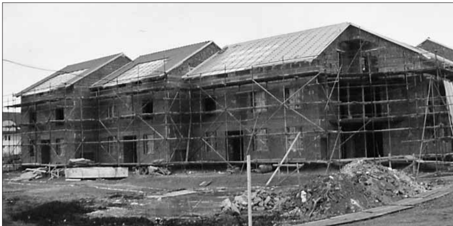
Nové obecní byty na ulici Polní mají být již počátkem léta připraveny k nastěhování prvních nájemníků