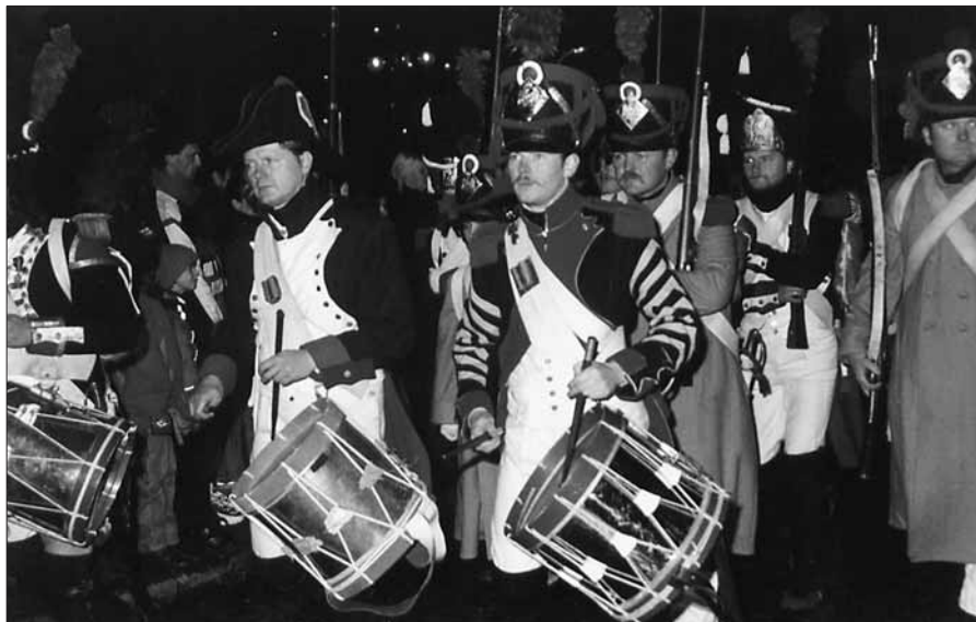
Průvod historických jednotek ve výročí bitvy tří císařů přilákal do Slavkova několik tisíc diváků