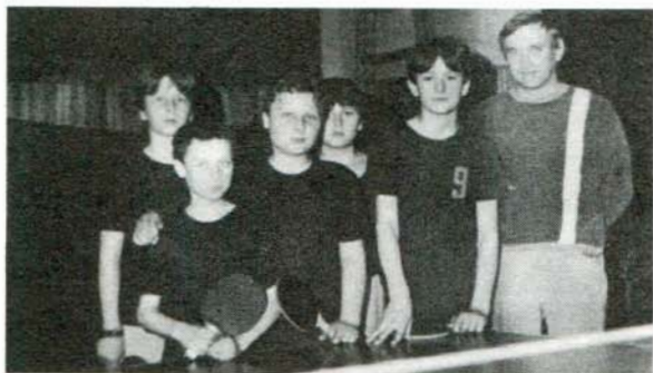
Finále žákovské ligy uskutečněno v Hlubočanech t.r.