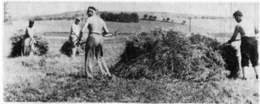
Jedni z mnoha brigádníků při sušení jetele a skládání do kupek.

by některé úkoly nemohly být zvládnuty. Šlo zejména o pomoc ve žních a zvláště při nočních výmlatech obilí ve dvoře Pod oborou, které zajišťovali brigádníci ze závodů, úřadů a institucí, včetně lékařů a zdravotníků. Nebo jakým problémem bylo sušení obilí, a to na Bučovské ulici, až po benzinovou pumpu, výpomoc obyvatelestva při ošetřování tohoto obilí, zvláště, když hrozilo deštivé počasí. Obilí se muselo shrnovat do hromad a přikrývat je. Čištěno bylo za pomoci velkých fukarů. Za zmínku stojí také obětavá práce pracovníků s koňskými potahy, kterých na počátku bylo 18 párů! Také ruční sečení trávy na zamokřených pozemcích, ruční obsékání honů s obilím, sbírání vyoraných brambor a další práce mohly být zvládnuty jen díky výpomoci občanů, žáků, příslušníků armády, brigádníků z továren a institucí, ba i účastníků protialkoholní léčebny, která tehdy ve Slavkově existovala. Zvláště výrazná byla pomoc STS ve Slavkově v době, kdy