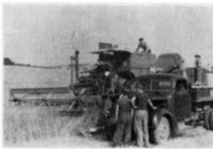
První kombajn na družstevních lánech — symbol nové techniky a odstranění dřiny.

ní základů socialistické velkovýroby v zemědělství v našem městě.