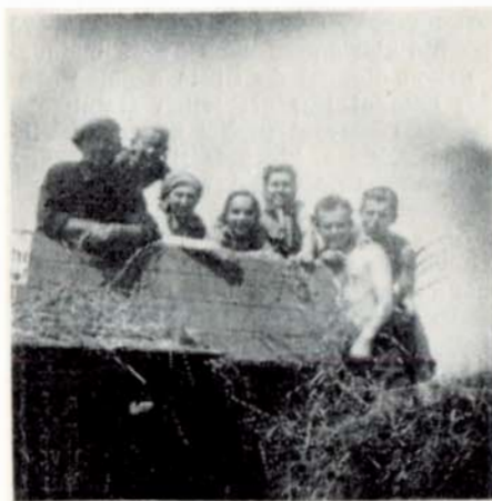
Vážanští mládežníci na žňové brigádě.

Ale to již se naplno rozbíhala přesvědčovací kampaň pro založení JZD. Rolníci ještě význam kolektivizace nechápali, někteří věřili našeptavčům, že vstupem do JZD budou okradeni, že se z nich stanou děvečky nebo čeledíni a pod. Zamykali proto domy před agitačními dvojicemi, tyto přijímali nepřátelsky, bouchali vším, co měli po ruce, dokonce hrozili násilím či sebevraždou. Bylo třeba velkého, trpělivého úsilí. Na druhé straně domkaři, stavo- a kovozezemědělci,