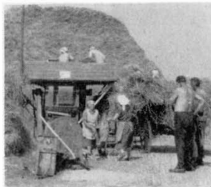
Těžká a dnes již pomalá práce ve žních.

JZD nestačilo všechnu půdu, kterou mělo k dispozici, kvalitně obdělávat,