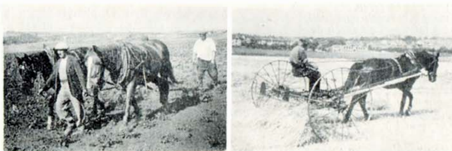
Na počátku byl kůň nejpětším pomocníkem družstevníků.