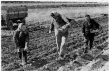
Družstevnice při sázení raných brambor.

Za zmínku stojí to, že v cyklu C byla v r. 1951 rozdělena půda mezi zemědělce, kteří ji obdělávali společně a o sklizeň se dle míry práce dělili (kromě okopanin). Tím se dosáhlo lepšího plnění dodávek státu.