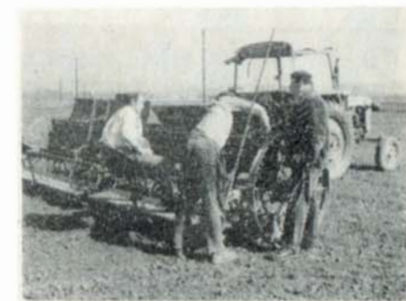
Traktory STS v prvních počátcích byly velkou posilou při seti obilovin.

Traktoristé po založení prvních JZD pracovali obětavě ve dne i v noci, bez teplého oblečení, na traktorech bez kabin, v dešti i blátě.