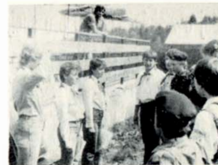
Snímek ukazuje pionýry při ranním nástupu.