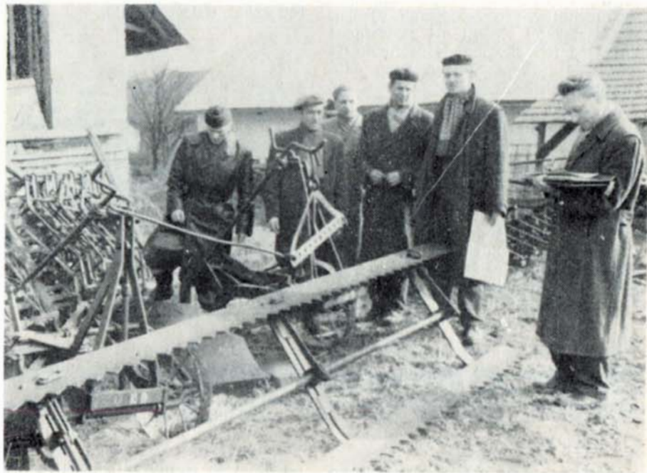
Že JZD jsou již dostatečně konsolidované a také schopné si většinu prací zajistit sami svými pracovníky bylo předávání strojů z STS do JZD v roce 1958. Na snímku předávání strojů JZD Slavkov.

Po reorganizaci v roce 1960 byly sloučeny opět okresy Vyškov, Slavkov a Bučovice. I STS byla sloučena