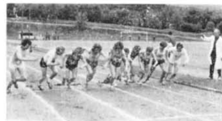
Nechť start Slavkovské míle přiláká znovu mnoho dalších závodníků

Odbor Základní a rekreační tělesné výchovy plánuje ve spolupráci se ZŠ Komenského nám. a PO SSM pro děti 5.—8. tříd v rámci naplnění směrnice o využití volného času dětí a mládeže akci „Zimní prázdniny v pohybu“. Podle počasí, sněhových podmínek apod. bude dětem umožněno organizované lyžování, bruslení, zájezd na krytou