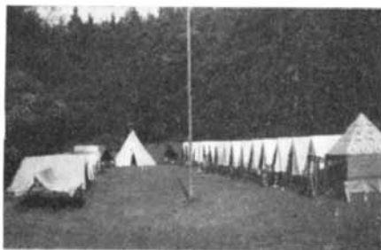
Stanová základna tréninkového tábora atletů a cyklotrialů v Přesovicích na Třebíčsku.

Závody se uskutečnily opět v areálu mysliveckého sdružení na střelnici, kde jsme získali pochopení a ochotu k propůjčení i vlastní budovy. Děti se zde mohly v klidu a v pěkném prostředí občerstvit, což si za podané výkony zasloužily.