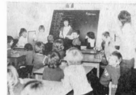
Soutěž „Buď anebo“ pro školní družinu

Jedním z úkolů domů pionýrů a mládeže je usilovat o rozvoj technické a přírodovědné činnosti. Na MDPM ve Slavkově u Brna se tak děje v elektrotechnickém kroužku pod vedením s. P. Terbere, který současně vede i fotokroužek. Chlapci z elektrotechnického kroužku mají k dispozi-