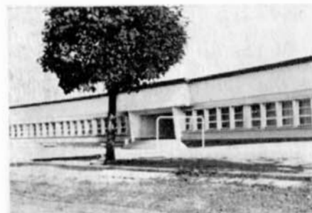
Škola v Darney pro 200 dětí