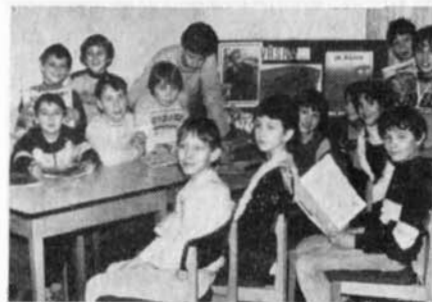
Zájmový kroužek Mladí historikové