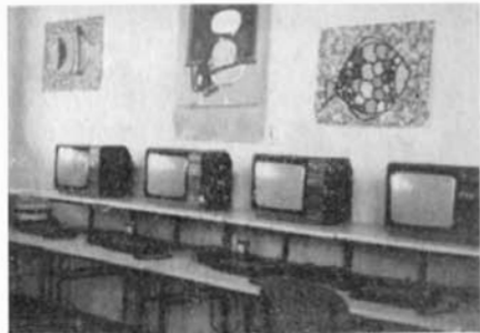
Třída darneyské školy na výuku programování

řovat lidé a krojovaná kapela v historických krojích v počtu 65 hudebníků. Následně byl seřazen průvod, se kterým jsme odešli na malé náměstí, kde proběhl slavnostní ceremoniál — odhalení desky nesoucí text: „Náměstí Družby — Slavkov — Darney 22. srpna 1987“ a dále byly odhaleny znaky měst Slavkova a Darney.