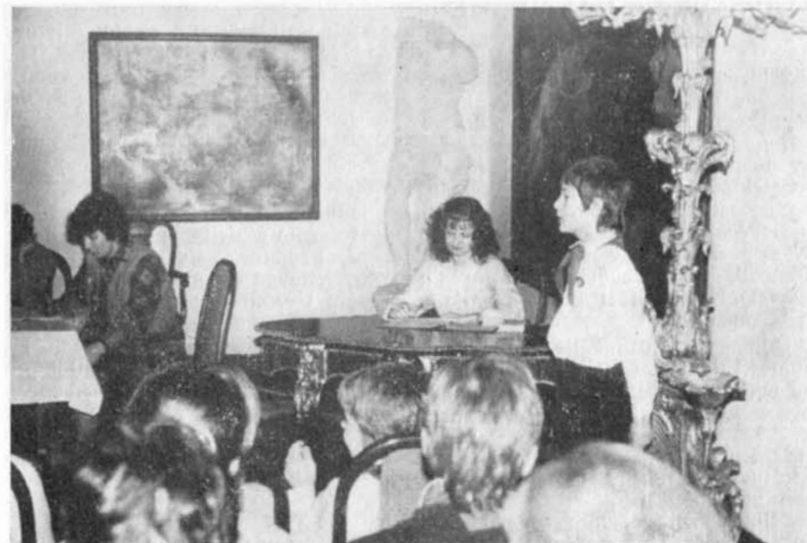
Městské kolo v recitaci proběhlo v Rubensově síle slavkovského zámku