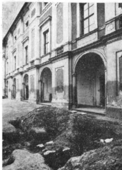
Takto vypadalo slavkovské nádraží počátkem roku 1947. Porovnat může- me všichni

nové dohodě, která původní termín překládá na jaro 1988. Podrobněji seznámíme čtenáře s novou expozicí v příštím čísle, zde je zdůrazněna jen pro svůj nepochybný význam a snad také proto, že přes problémy a změnu termínu, bylo její přípravě věnováno dosti času i v uplynulém roce.