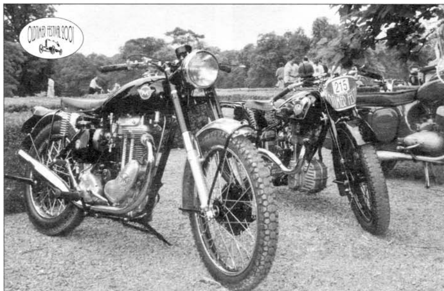
Motorcykl dnes už neexistující slavné anglické značky Matchless.