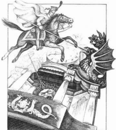
Z výstavy grafik Karla Zemana.