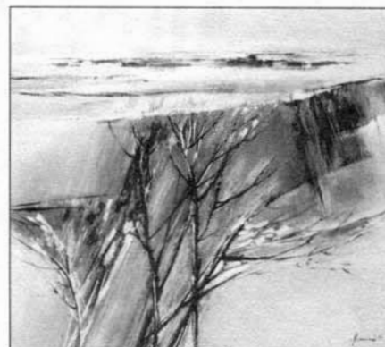
Jeden z obrazů Jarmily Lorencové.

– uzavření smlouvy č. 97/2001 o závazku veřejné služby ve veřejné linkové osobní dopravě mezi ČSAD Vyškov, a.s. a Městem Slavkov u Brna