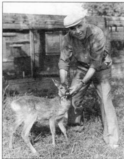
E. Pohle-ochránce přírody.