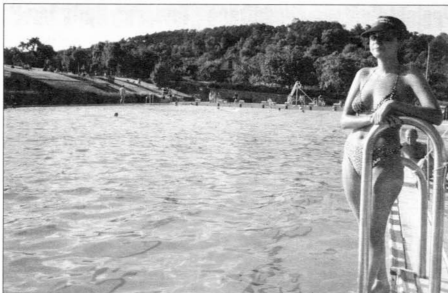
Voda 24 °C, vzduch 28 °C - ideální podmínky pro návštěvu koupaliště.

Totálně zaplevelené ladem ležící pozemky se stávají problémem našeho okolí. Jsou zdrojem obtížně hubitelných plevelů, původců chorob a škůdců pro sousední porosty, na nichž se pak enormně zvyšují náklady na ochranná opatření. Pěstování některých plodin, jako jsou brambory a řepa až zcela znemožňují. Rostlinné společenstvo na ladem ležících pozemcích se stává plošným ohniskem alergologicky významných rostlin, které zvyšují reaktivitu směsi pylů dalších druhů rostlin. Jsou také zdrojem nejvýznamnějších alergenních plísňí rodu Alternaria . Vedle těchto vedlejších účinků způsobují zaplevelené pozemky narušení ekologické rovnováhy v krajině. Heslo „příroda si pomůže sama“ je nepravdivé. Širokolisté hluboko kořeničící plevele se během pěti až sedmi let změni v pyrové společenstvo, které značně znesnadní budoucí opětovné obhospodařování. Cesta ze současného stavu vyžaduje buď pozemky trvale zatravnit, nebo zavádět krátkodobé úhory oseté plodinami na zelené hnojení. Cestou k udržení pozemků bez plevele je i me-