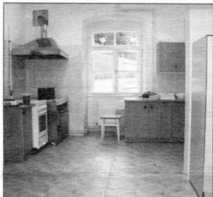
Kuchyně v MŠ Koláčkovo nám.

Slavkovská iniciativa smíření pořádá již VI. ekumenické setkání s celodenním programem, který je uveřejněn samostatně na straně 1 a 3 Zpravodaje. HM