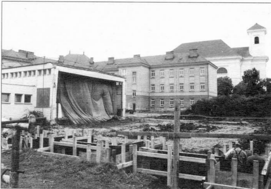
Práce na výstavbě nové tělocvičny pokračují.

Ve středu 7. 10. odjíždějí naši žáci na výměnný pobyt do anglického Bexhillu. Vráti se 17. 10. a v týdnu od 31. 10. do 7. 11. přivítají naše anglické přátele ve Slavkově. Vladimír Soukop