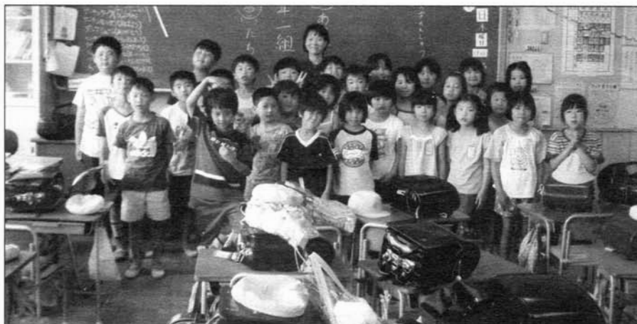
Fotografie japonských dětí, které si dopisují s dětmi ze školní družiny ZŠ Komenského nám.