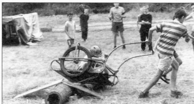
Z letošních junáckých táborů. ▲ ▼

Blíže informace a přihlášky denně v DDM Slavkov od 8 do 16 hodin, tel. č. 05/44 22 17 08.