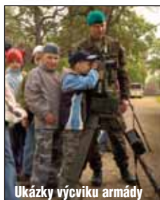
Ukázky výcviku armády