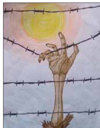
Ukázky oceněných výtvarných prací