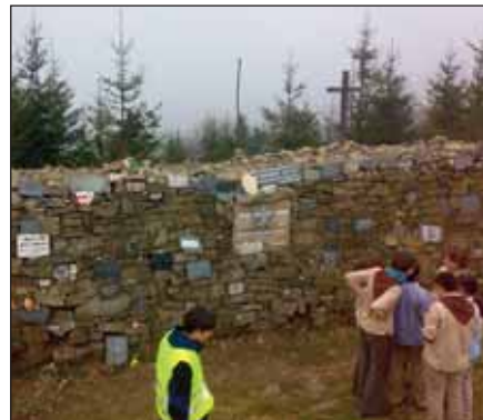
Legendární skautská mohyle Ivančena v Beskydech.

VV SK Slavkov u Brna děkuje všem hráčům za předvedené výkony, trenérům a funkcionářům za jejich obětavou práci a také všem sponzorům i fanouškům za jejich přízeň! A na městském stadionu se zase sejdeme asi v polovině srpna, kdy bude zahájena podzimní část soutěžního ročníku 2008/2009. rs