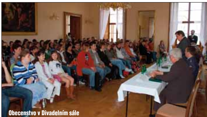
Obecenstvo v Divadelním sále