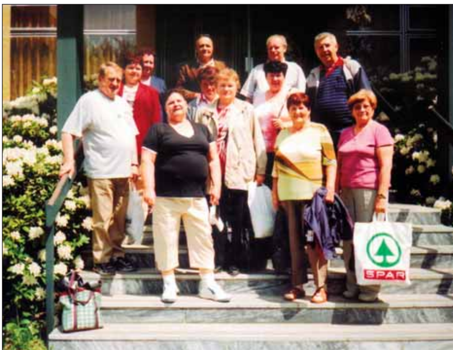
Účastníci rekondičního pobytu pro diabetiky v lázních Luhačovice. Vpravo otevírání pramenů.