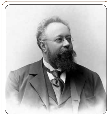
ZÁMEK SLAVKOV – AUSTERLITZ a MĚSTO SLAVKOV U BRNA