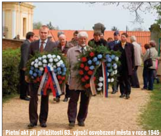
Pietní akt při příležitosti 63. výročí osvobození města v roce 1945