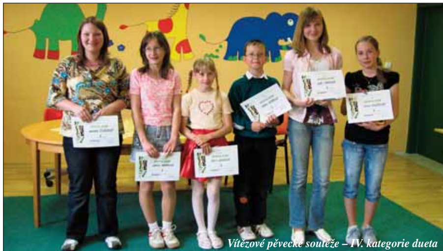
Vítězné pěvecké soutěže – IV. kategorie dueta