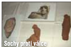
Sochy proti válce