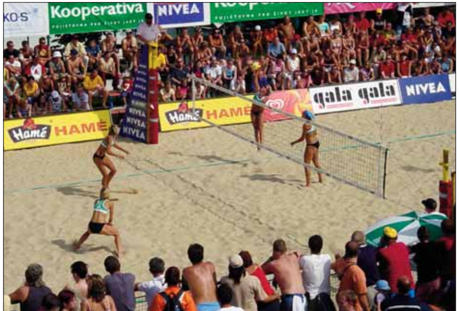
Snímek se vracíme k poslednímu MR žen, které se u nás uskutečnilo v roce 2005 a v němž z vítězů útočící dvojice Klapalová-Petrová, jež v současné době bojuje na turnajích Světové série o účast na OH v Pekingu.

V polovině měsíce dubna byly vytvořeny nové webové stránky www.beachvolleyballcz.cz , kde naleznete vyčerpávající informace týkající se klubu a beachvolejbalu u nás i ve světě.