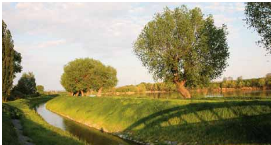
Foto z akcí na www.jinlong-club.cz