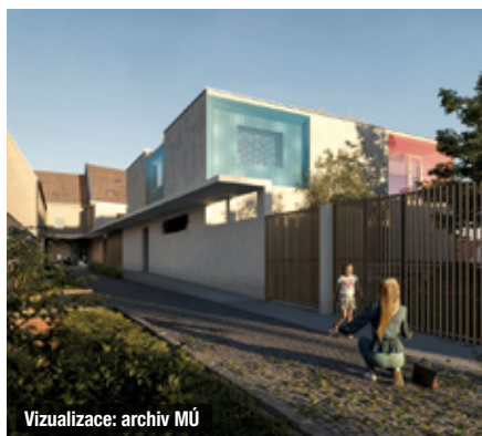
Vizualizace: archiv MÚ