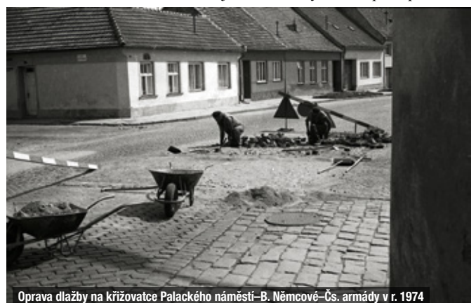
Oprava dlažby na křižovatce Palackého náměstí–B. Němcové–Čs. armády v r. 1974