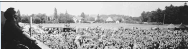
Süddeutsche Sonntagspost 1949: „Zůstává mi rozum stát!“ Bruno Gröning uzdravuje ochrnuté, slepé, němé ...

senná rýma revma alergie poruchy zraku deprese závislost na alkoholu bulimie poruchy srdečního rytmu závislost na drogách samovolný únik moči migréna artritida ADHS roztroušená skleróza