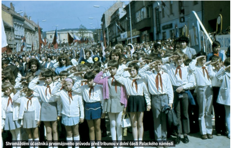
Shromáždění účastníků prvomájového průvodu před tribunou v dolní části Palackého náměstí

Dalších 13 hlavních oblastí rozvoje obsahovaly desítky položek, z nichž nejzajímavější byl záměr vybudovat krytý bazén a kryté kluziště v areálu stadionu, zřízení samostatného podniku Technické a zahradní správy města,