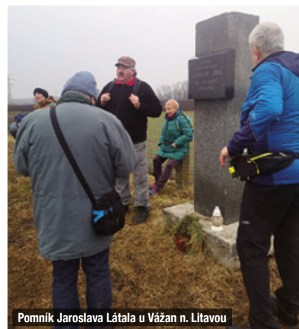
Pomník Jaroslava Látala u Vázan n. Litavou

kém Mederu. Pokud si budete chtít také užít léčivých a hlavně teplých pramenů lázně Dunajská Streda, máte možnost se každé pondělí v době od 14 do 16 hod. v klubovně přihlásit. Přípravené zájezdy se uskuteční 9. dubna a 30. května. Pro přátele muzikálů je připraven zájezd do Městského divadla v Brně na Noc na Karlštejně, a to 2. března. Dále vás srdečně zveme na akci, kdy budete mít možnost se znovu sejít ve velkém stylu v sále na Bonapartu a oslavit MDŽ, a to ve známém termínu, 8. března. Pochopitelně se můžeme těšit na zajímavý program. Přeji dobrou náladu a hlavně chuť se přidat k jakékoliv akci. Klub Seniorů Slavkov u Brna z.s.