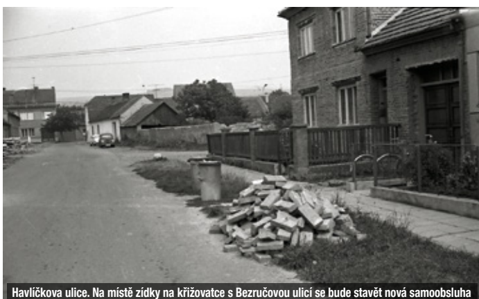
Havličkova ulice. Na místě zidky na křižovatce s Bezručovou ulicí se bude stavět nová samoobsluha