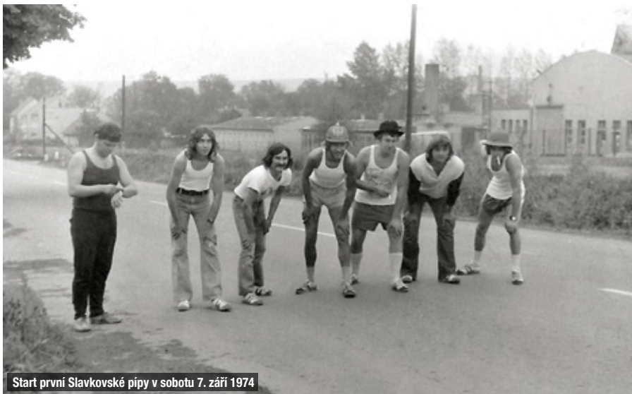
Start první Slavkovské pipy v sobotu 7. září 1974

Členskou základnu rybářů se podařilo rozšířit, ke konci roku měla 305 členů (nárůst 32 členů). Rybáře potrápily tři velké otravy rybníků – na jaře malého rybníka a při řepné kam-