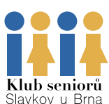
Klub seniorů Slavkov u Brna

I když je zatím počasí úplně někde jinde, než by příslušelo tomuto období, co je nevhodné pro přírodu, vyhovuje vycházkám. Na fotografiích se můžete seznámit s tím, co lze vidět v našem nejbližším okolí – Těšanka, Křenovice. Výpravy jsou stále obsazeny těmi, co se touží projít, něco poznat, vzájemně si popovídat. Myslel jsem si, že vás seznámím s vycházkou Valentinskou, ale uzávěrka pro dodání příspěvků je neúprosná, tak láska počká. Ve chvíli, kdy dostanete březnový zpravodaj budou první zájemci užívat termálních pramenů ve Vel-