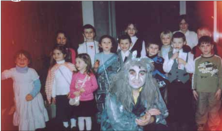
Děti ze ŠD s představitel hlavní role.