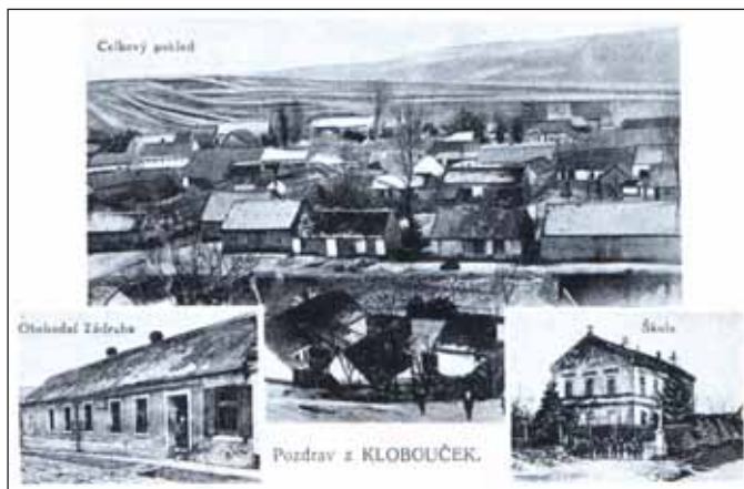
Kloboučky – 1. pol. 20. stol.

Historické muzeum ve Slavkově u Brna má ve svém sbírkovém fondu čtyři pohlednice Klobouček. Všechny představují pohledy na obec z první poloviny 20. století.