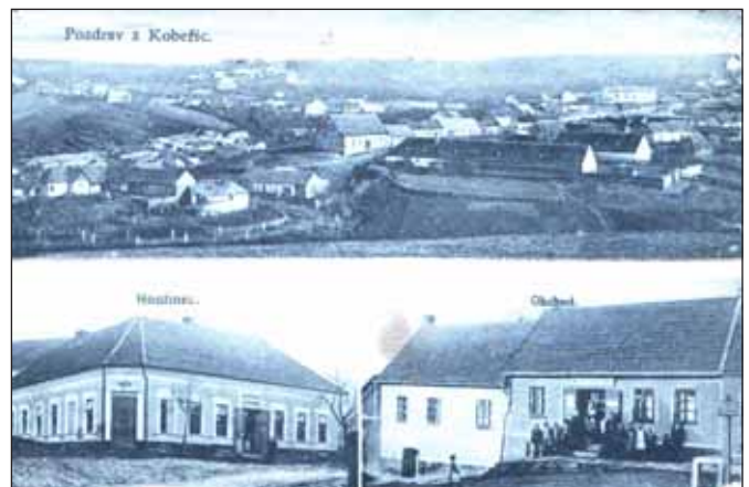
Koberice – 1. pol. 20. stol.