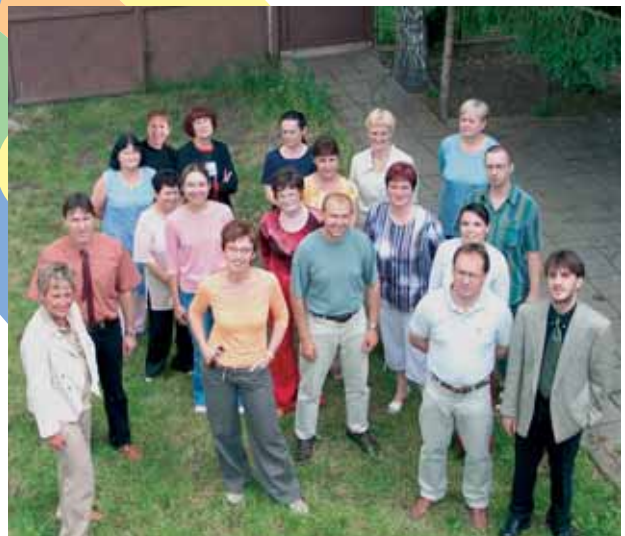
Brněnská skupina Kern, vokály doprovod – současní žáci ZUŠ