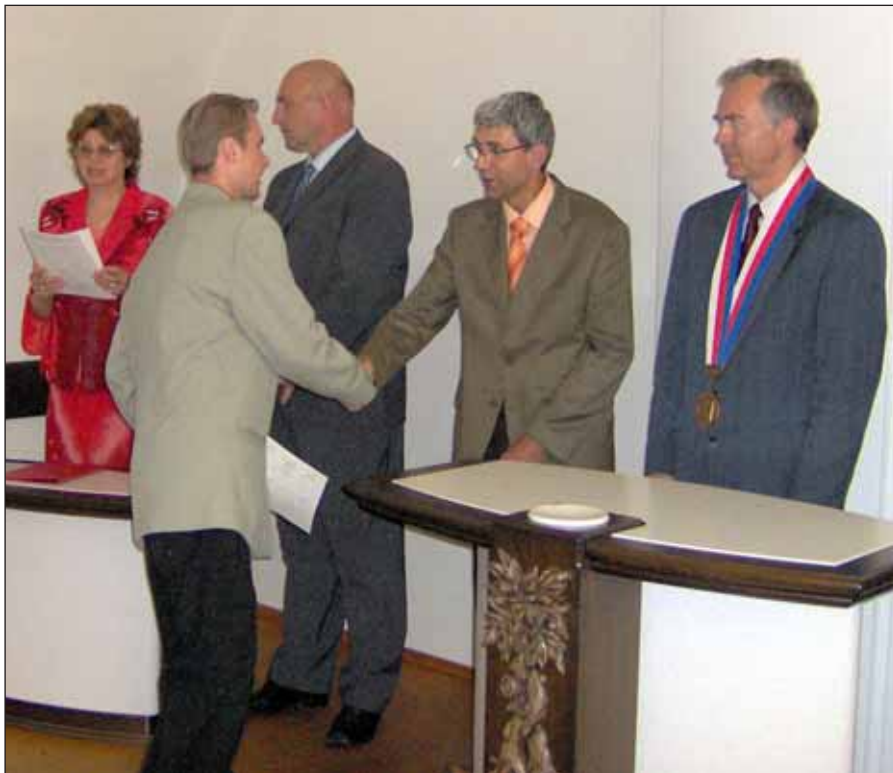
Předávání maturitních vysvědčení.

Střední odborné učiliště nábytkářské je jediná samostatná střední škola působící v Rousínově. S platností od nového školního roku (1. září 2006) dochází k několika významným změnám , které podstatně ovlivní její další budoucnost.