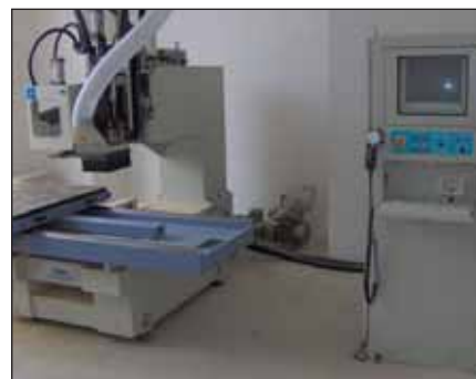
Nové CNC obráběcí centrum.

Škola ve své více než stoleté historii pro-