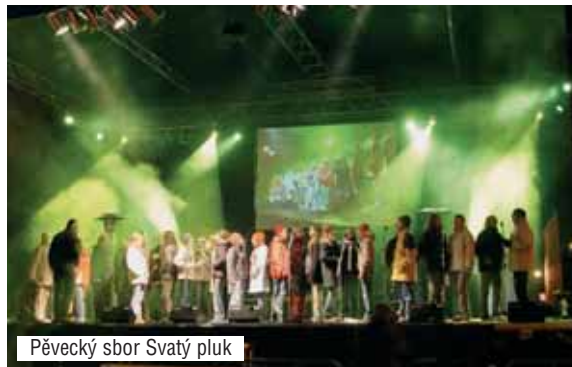
Pŕevŕecký sbor Svatý pluk