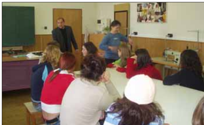
Děvčata ZŠ Tyršova a učnice 3. ročníku oboru krejčová při zajímavé besedě.