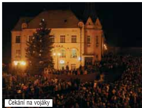
Čekání na vojáky