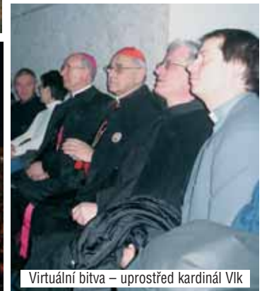
Virtuální bitva – uprostřed kardinál Vlk