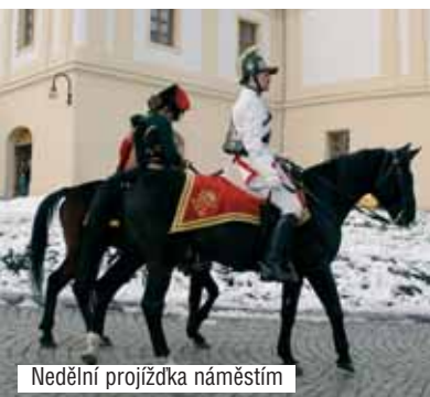
Nedŕlní projížďka námŕstím