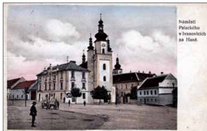
Náměstí v Ivanovicích na Hané.