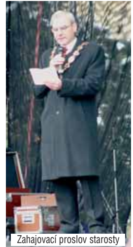
Zahajovací proslov starosty