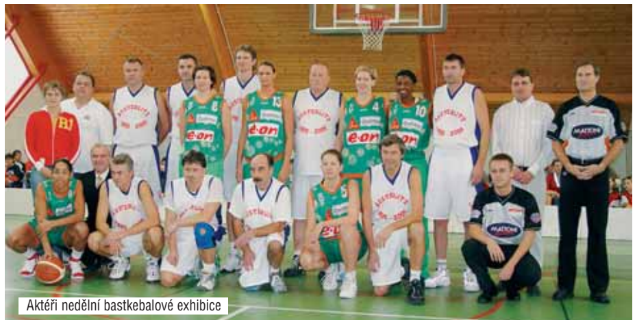
Aktŕtŕi nedŕlní basketbalové exhibice