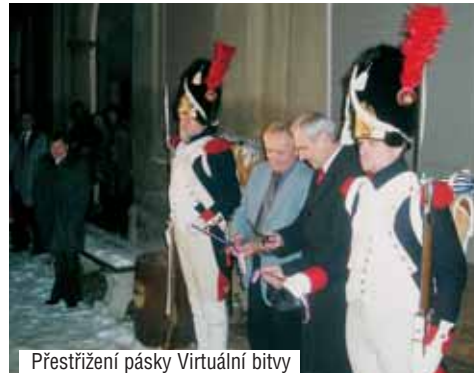
Přestřizení pásky Virtuální bitvy