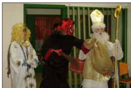
Mikulášská nadílka v DDM.

Doufáme, že se vám bude výstava líbit a zároveň přejeme pěkné vánoční svátky a šťastný NOVÝ ROK 2006. vychovatelky a žáci ŠD