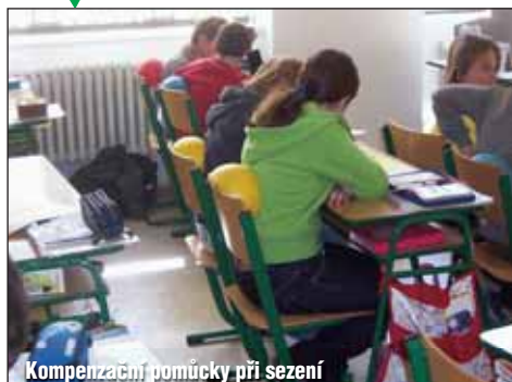
Kompenzační pomůcky při sezení