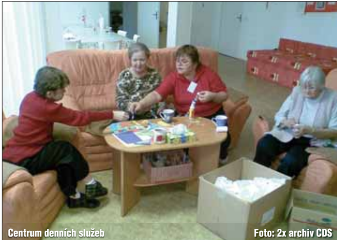
Centrum denních služeb