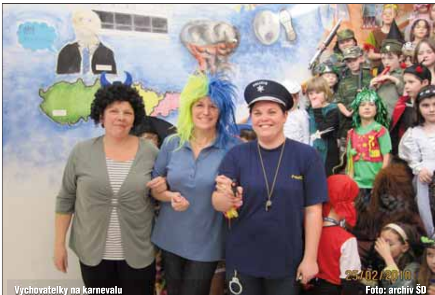
Vychovatelky na karnevalu