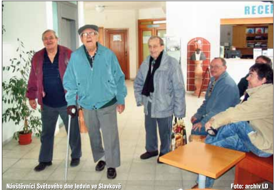
Návštěvníci Světového dne ledvin ve Slavkově