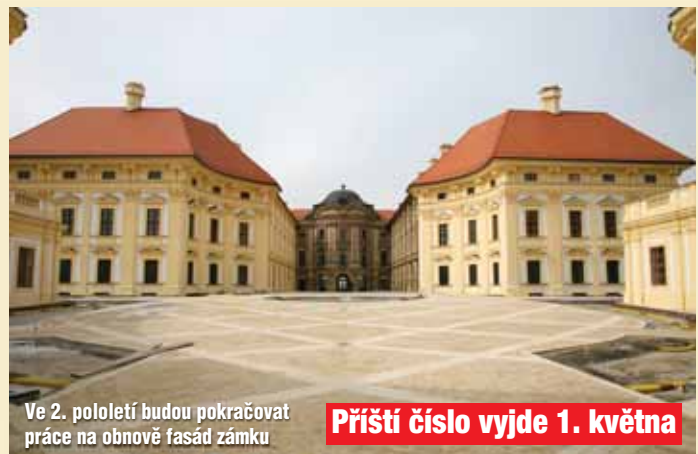
Ve 2. pololetí budou pokračovat práce na obnově fasád zámku