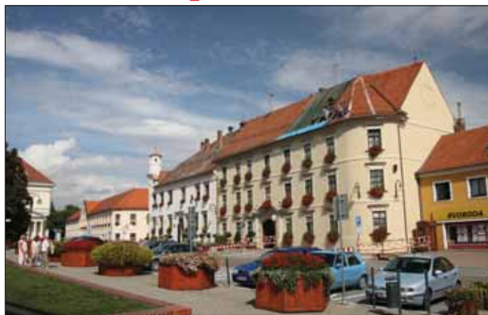
Oprava střech radnice

6. V roce 2007 město rozhodlo o revitalizaci bytových domů na sídl. Nádražní 1153-1158 (celkem 3BD, 54 bytových jednotek) a následně privatizaci této části svého bytového fondu. Po revitalizaci BD na sídl. Nádražní 1155-1156 (1. etapa) dochází k prodeji bytových jednotek (18 bytů) nájemníkům. V současné době jsou nabízeny BD čp. 1153-1154 (2. etapa) a probíhá revitalizace BD čp. 1157-1158 (3. etapa). Díky získaným zdrojům z prodeji bytových jednotek a zdrojům z nájemného, kdy město k 1. 1. 2010 využilo své poslední možnosti k jednostrannému navýšení nájemného, jsou plánovány na rok 2010 tyto akce: výměna balkonů v 52 bytových jednotkách na sídl.