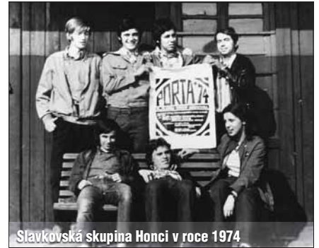
Slavkovská skupina Honci v roce 1974