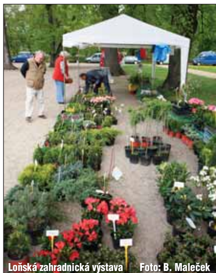
Loňská zahrádkářská výstava

Výstava bude probíhat v historických saloncích. Zahájení výstavy 1. dubna v 17 hodin v Historickém sále. ZS-A