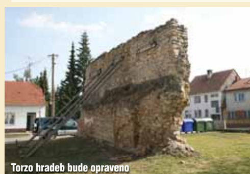
Torzo hradeb bude opraveno