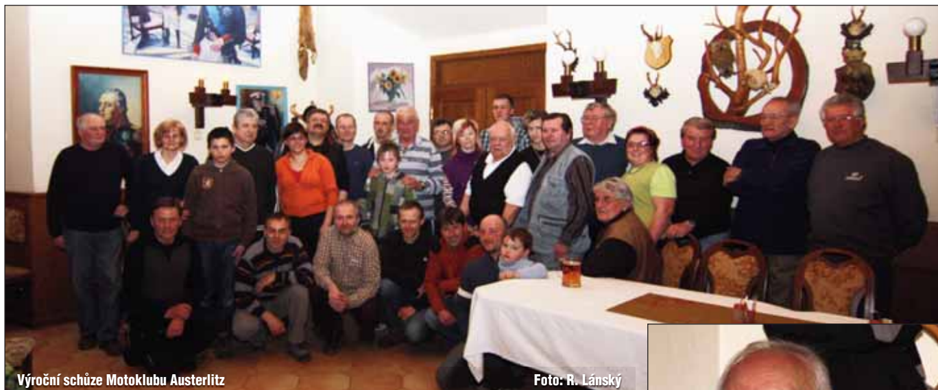
Výroční schůze Motoklubu Austerlitz