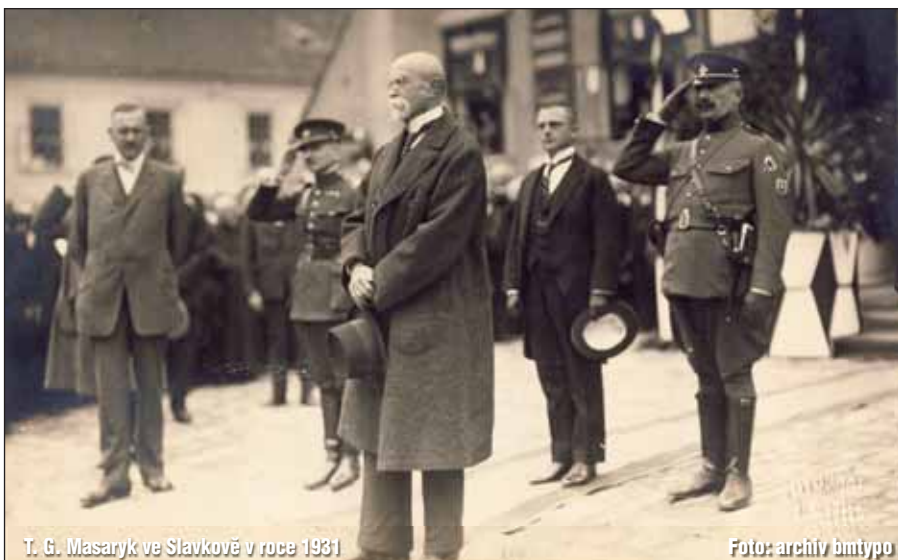
T. G. Masaryk ve Slavkově v roce 1931