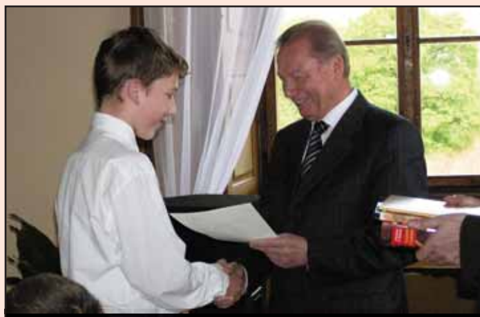
Soutěžní fotografie • Soutěžní fotografie

Otázka: V roce 2007 navštívil slavkovský zámek prezident jednoho evropského státu (na fotografii vpravo). Kdo to byl?