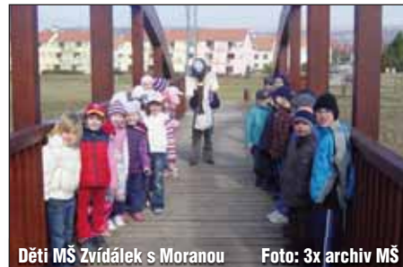
Děti MŠ Zvídálek s Moranou