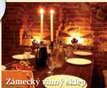
Zámecký vinný sklep