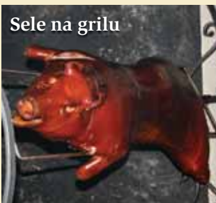
Sele na grilu