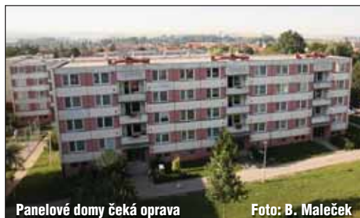
Panelové domy čeká oprava

Celkové náklady na komplexní projekt činí 68,8 mil. Kč, z toho způsobilé výdaje jsou 62,8 mil. Kč a nezpůsobilé výdaje 6,0 mil. Kč. Město Slavkov u Brna se na celém záměru bude podílet částkou 10,7 mil. Kč. Termín fyzické realizace se předpokládá od 6/2010 do 1/2013.