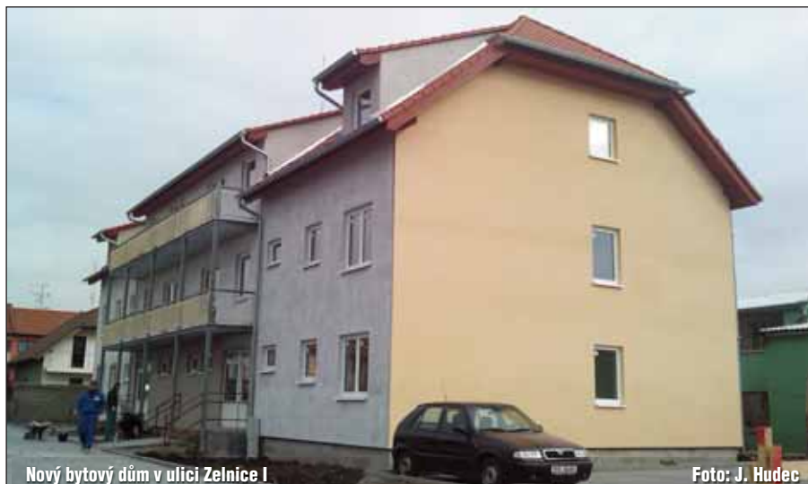
Nový bytový dům v ulici Zelnicí