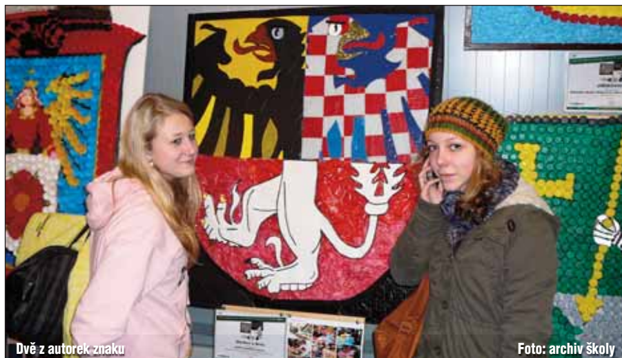
Dvě z autorek znaku