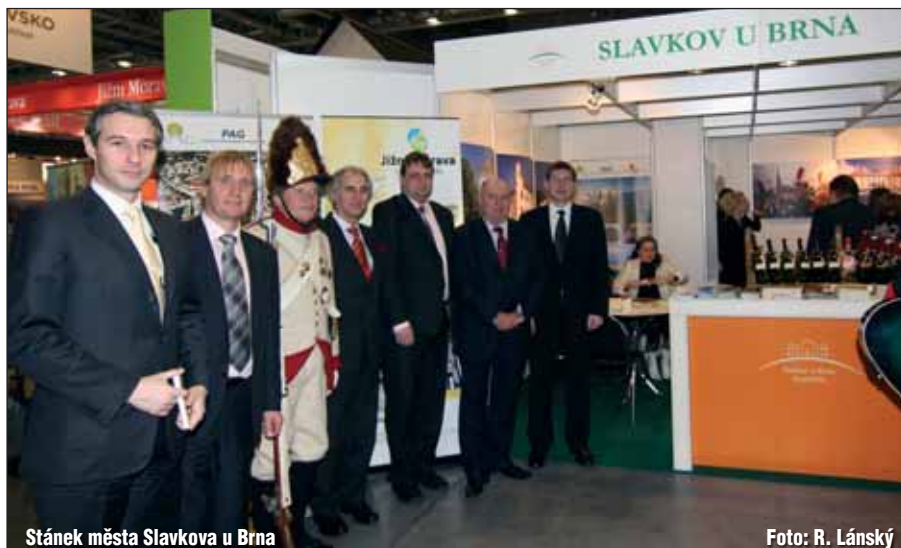
Stánek města Slavkova u Brna