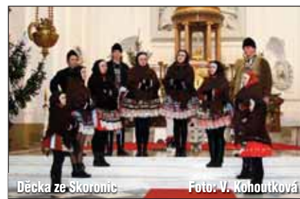
Děčka ze Skoronic