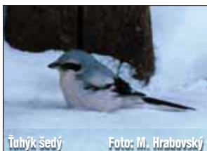
Tuhyk šedý