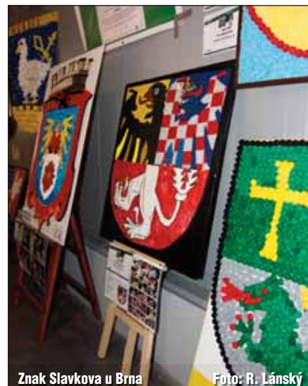
Znak Slavkova u Brna