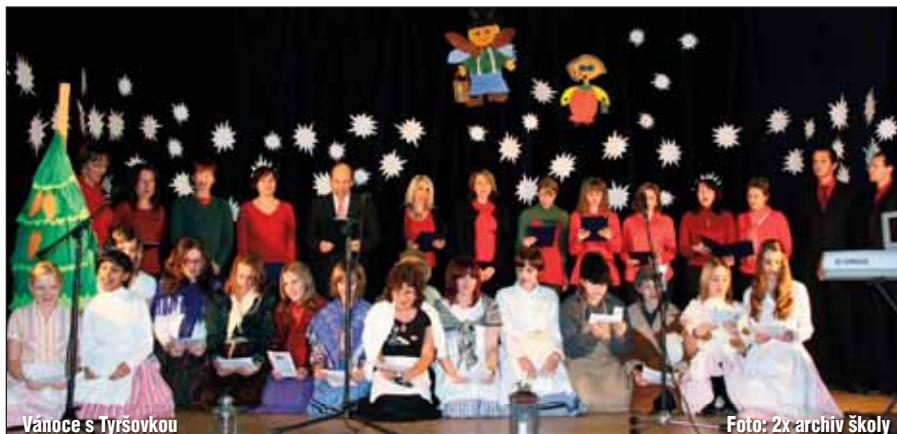
Vánoce s Tyršovkou

Vrcholem předvánočního týdne se stala stejně jako v minulých letech tradiční školní akademie nazvaná Vánoce s Tyršovkou. Děti připravily pod vedením svých vyučujících pro své rodiče pásmo říkanek, básniček a písniček. Velký úspěch mělo také cvičení zumbly a závěrečná koleda v podání učitelského sboru. Celým programem se prolínaly vánoční