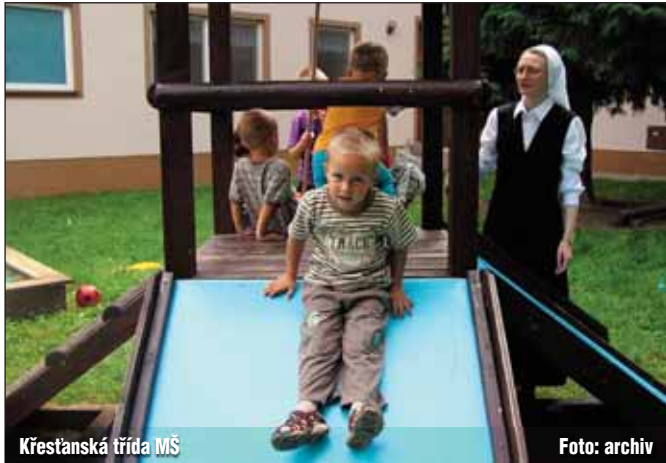
Křesťanská třída MŠ