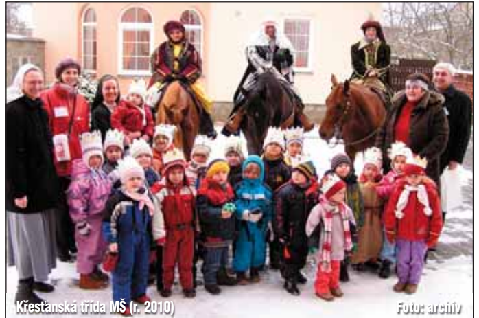
Křesťanská třída MŠ (r. 2010)