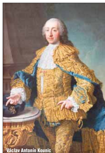
Václav Antonín Kounic

V průběhu roku 2011 si bude Zámek Slavkov – Austerlitz připomínat tuto významnou osobnost při různých příležitostech. Součástí vzpo-