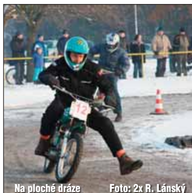
Na ploché dráze

nal na minibike , pokračoval na stroji honda o obsahu 70 cm 3 , na němž dosahoval dobrých výsledků a mnohokrát stál na stupních vítězů. V sezoně 2008 přešel do kategorie 125 cm 3 Sport, ve které se umísťoval na bodovaných místech i na stupních vítězů. Je to talent silničních rychlostních závodů s dobrým rodinným zázemím. Pokračuje v tradici jak dědy, tak i otce, kteří mají bohaté zkušenosti ze svých mladých let, kdy každý z nich několik roků závodil. Na základě Oldových výsledků v předchozích třídách bude letos startovat na stroji Honda 600 cm 3 sport . Přeme mu hodně úspěchů. J. M.