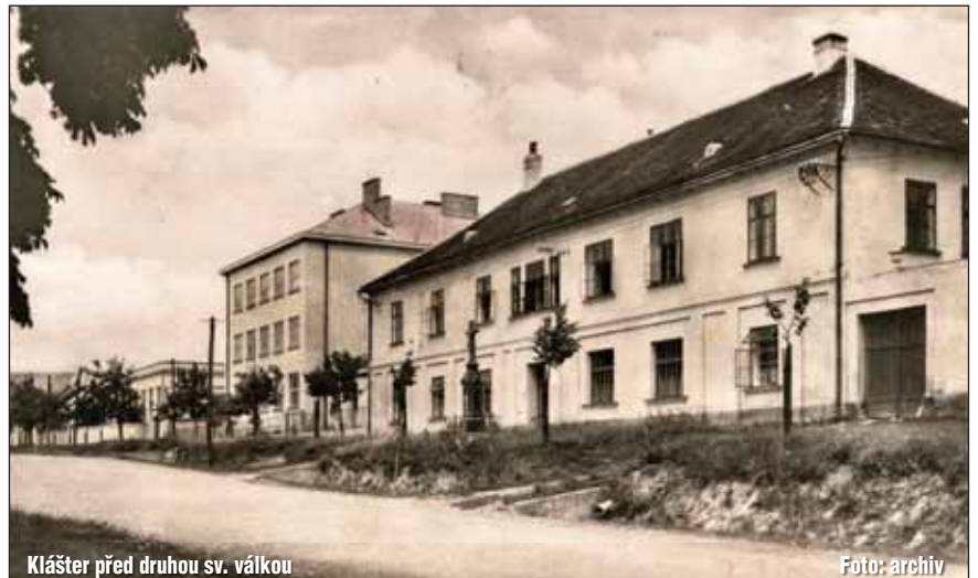
Klášter před druhou sv. válkou