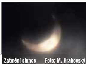
Zatmění slunce