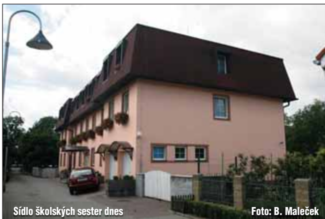
Sídlo školských sester dnes