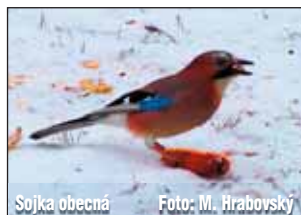
Sojka obecná