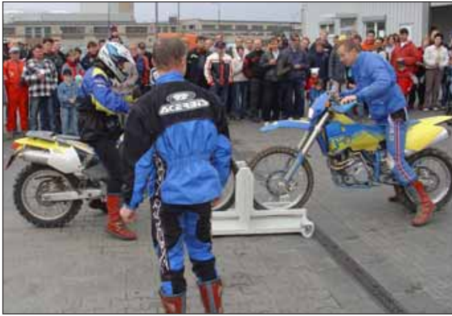
Přetlačovaná na motorkách vzbudila velký zájem diváků.