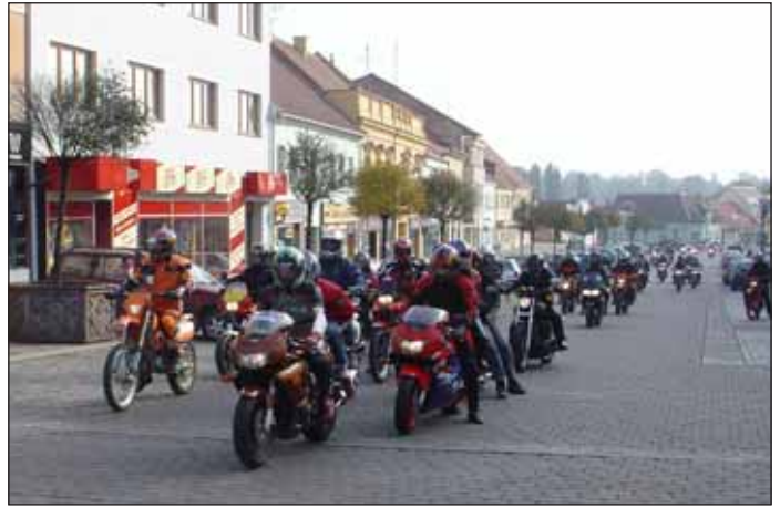
Motocyklové defilé na Palackého náměstí.