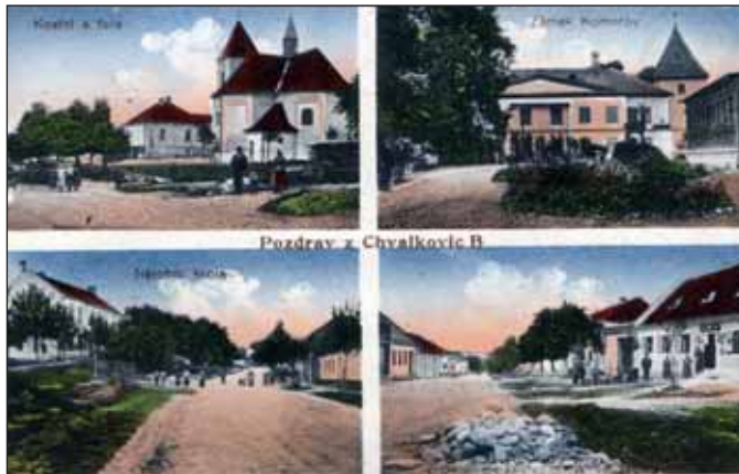
Chválkovice (u Bučovic), 1913