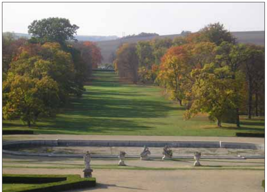
Zámecký park na podzim.