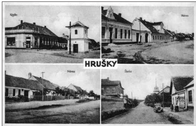
Obec Hrušky – druhé desetiletí 20. století

Historické muzeum ve Slavkově u Brna má ve svém sbírkovém fondu tři pohlednice Hrušek. Dvě ze druhé desetiletí 20. století, které představují pohledy na kapli P. Marie, školu a několik dalších pohledů na náves. Černobílá pohlednice z přelomu 60. a 70. let 20. století pak rovněž připomíná kapli P. Marie.