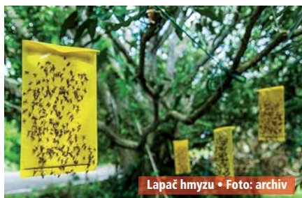
Lapač hmyzu

cereritem. K signalizaci škůdců jako jsou obaleči a pilátky vyvěšujeme do korun stromů feromonové lapáky a lepové desky. Určíme tak vhodnou dobu pro aplikaci ochranných prostředků a částečně omezíme i poškození plodů.