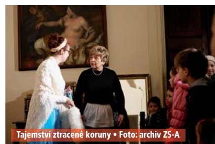
Tajemství ztracené koruny

Druhý ročník úspěšného letního festivalu letos představí hudební hvězdy jako Martu Jandovou, Rybičky 48, IMT Smile, Horkýžeslíže, Citron, Janka Ledeckého nebo britskou legendu sedmdesátých let The Rubettes. Festival se uskuteční 10. června od 11 do 01 hodiny ráno. Více informací naleznete na www.top-fest.cz . VS