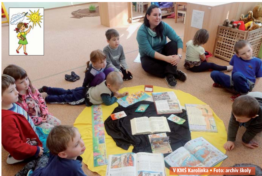
V KMŠ Karolínka • Foto: archiv školy