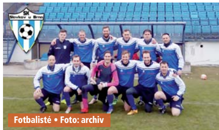
Fotbalisté • Foto: archiv