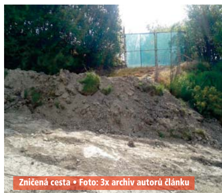
Zničená cesta