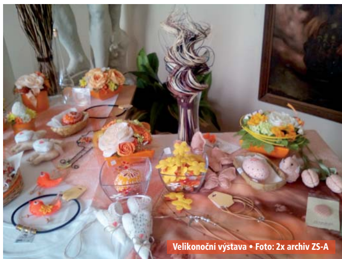
Velikonoční výstava

Věříme, že s novým předprodejním systémem budete spokojeni a my se na Vás těšíme na našich kulturních akcích. ZS-A