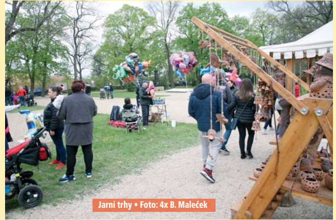
Jarní trhy