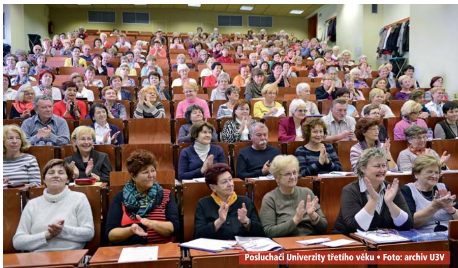
Posluchači Univerzity třetího věku

Přihlášky je možné podat osobně (Komenského nám. 2, Brno) nebo elektronicky od 2. května 2017 do 30. června 2017 . Další informace a podrobnosti o Univerzitě třetího věku MU naleznete na www.u3v.muni.cz . TZ