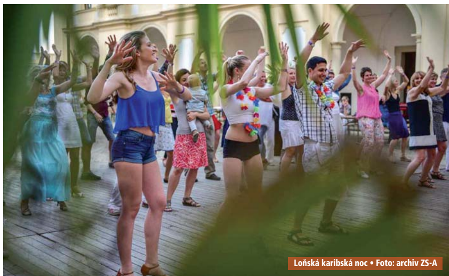
Loňská karibská noc • Foto: archiv ZS-A

sále slavkovského zámku. Předprodej vstupenek bude na informačním centru ve Slavkově od 31. 3. v infocentrum@zamek-slavkov.cz , tel. 513 034 156 nebo v obchodním domě „Hruška“ Pozoříce, Na Městečku od 18. dubna. ZS-A