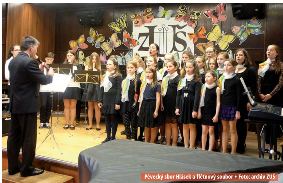
Pěvecký sbor Hlásek a flétnový soubor