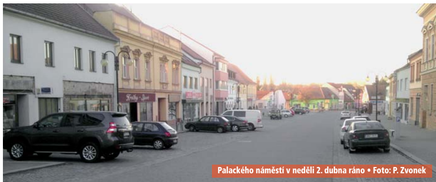
Palackého náměstí v neděli 2. dubna ráno

Díky projektu se uskuteční i další aktivity jako například miniveletrh zájmových organizací, dětské odpoledne v parku, řemeslný jarmark či kulturní vystoupení zahraničních souborů. Projekt je spolufinancovaný v rámci programu EU „Evropa pro občany“. vs