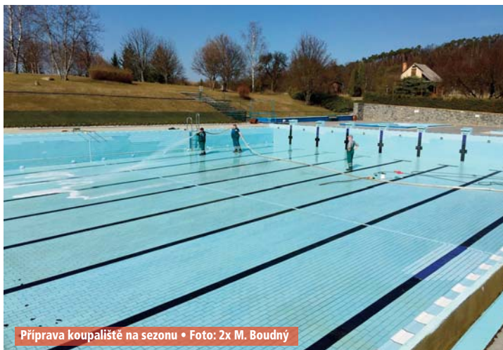
Příprava koupaliště na sezonu