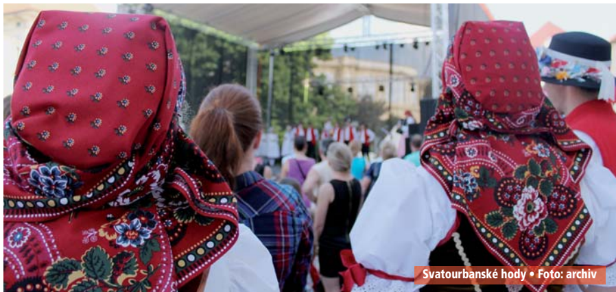
Svatourbanské hody