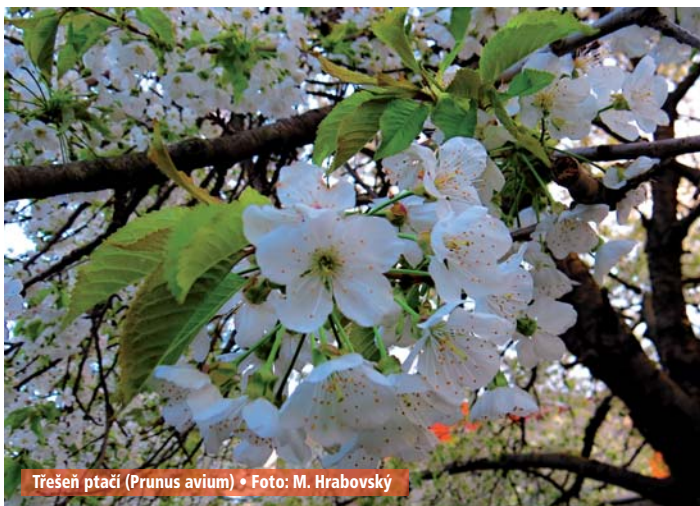
Třešeň ptačí (Prunus avium)