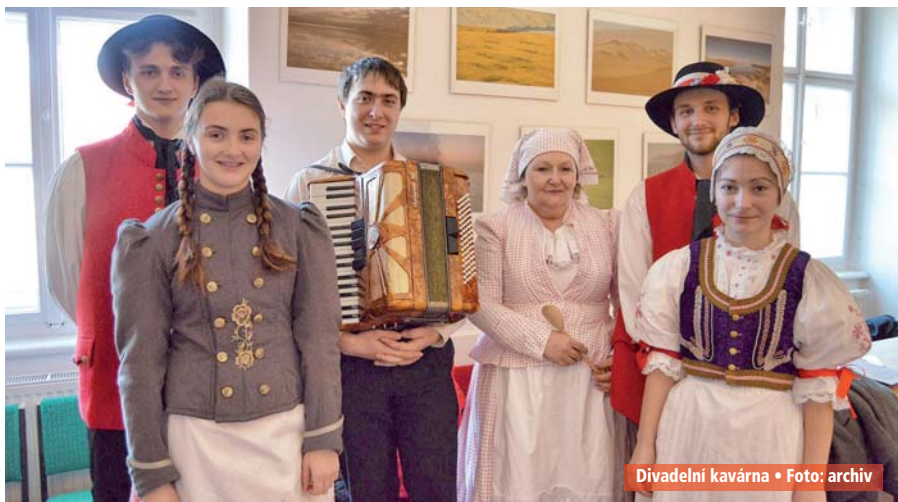
Divadelní kavárna

V sobotu projde průvod městem, který bude zakončen vystoupeními folklorních souborů z různých koutů Moravy. Večer bude hodová zábava s dechovou hudbou Sobuláci. V neděli budou hody zakončeny slavnostní bohoslužbou.