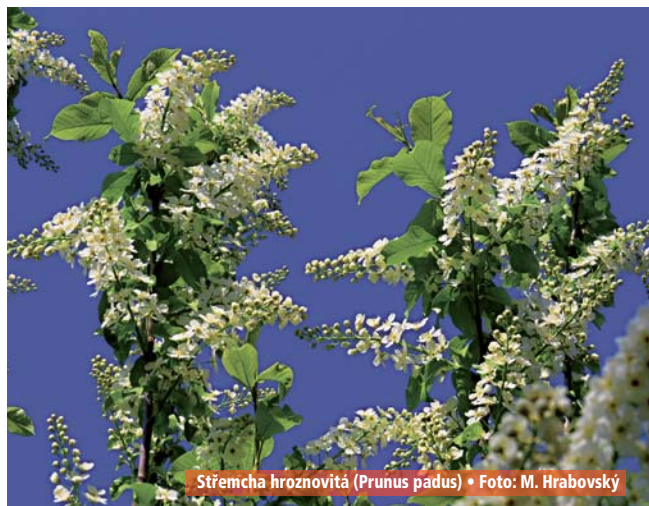
Střemcha hroznovitá (Prunus padus)