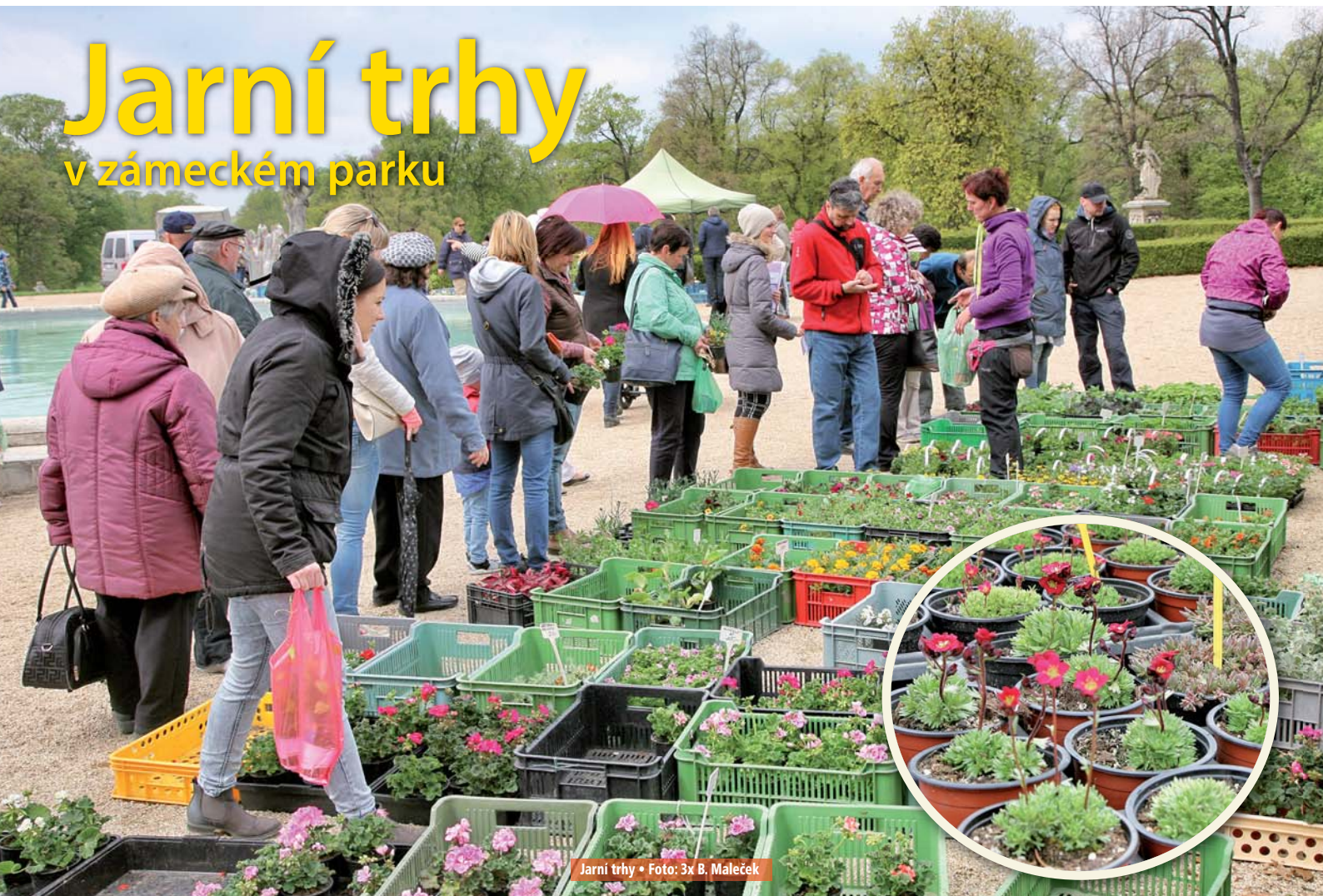
Jarní trhy • Foto: 3x B. Maleček