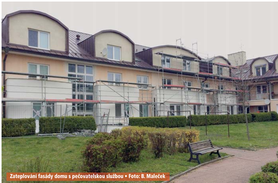
Zatepování fasády domu s pečovatelskou službou

V domě s pečovatelskou službou se nachází 62 bytů. Sídlí zde také pobočka Charity zabezpečující sociální služby. Jsou zde také prostory pro klub seniorů. Investicí do opravy fasády město předpokládá až dvacetiprocentní úsporu energií. vs