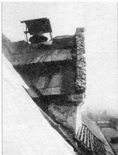
Takto vypadal portál s hodinami a zvonem v průčelí kostela Vzkříšení Páně na našem náměstí. Kdy bude hodinový stroj opět uveden do chodu dnes nikdo neví.