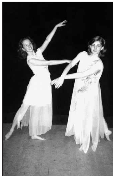
Závěrečné vystoupení tanečního sboru v sále Společenského domu