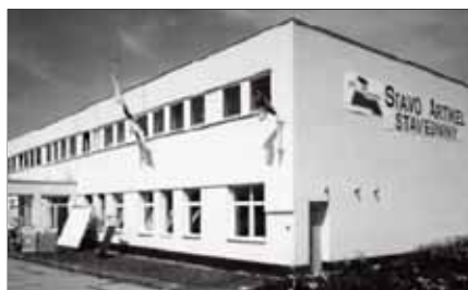
Budova firmy Stavo Artikel ve Slavkově.

Hlavním komerčním zaměřením firmy je prodej kompletního sortimentu stavebních materiálů včetně poradenské činnosti. Pro tento účel byla rekonstruována průčelní budova, kde vznikla moderní prodejna, umožňující bezprostřední kontakt klienta se stavebními materiály. Návazně došlo k rozsáhlé přestavbě původní budovy pro opravu traktorů, která slouží jako hala pro výrobu interiérových dveří a zakázkovou výrobu nábytku. Pro