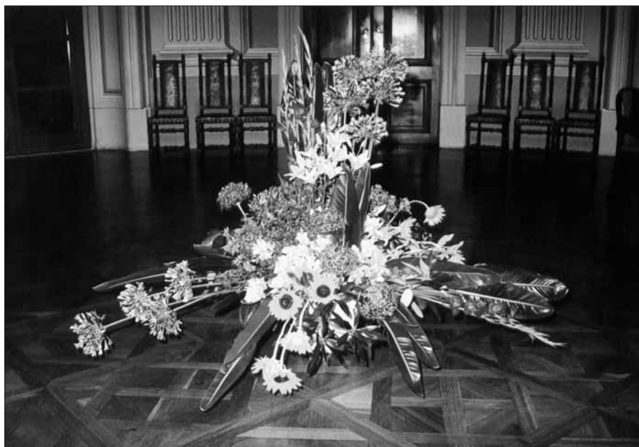
Přímo v areálu zámku si mohli návštěvníci prohlédnout historickou vazbu živých květin.