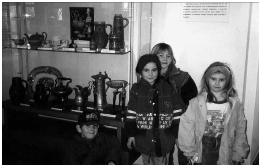
Děti ze školní družiny při ZŠ Komenského se účastní řady zajímavých výletů.