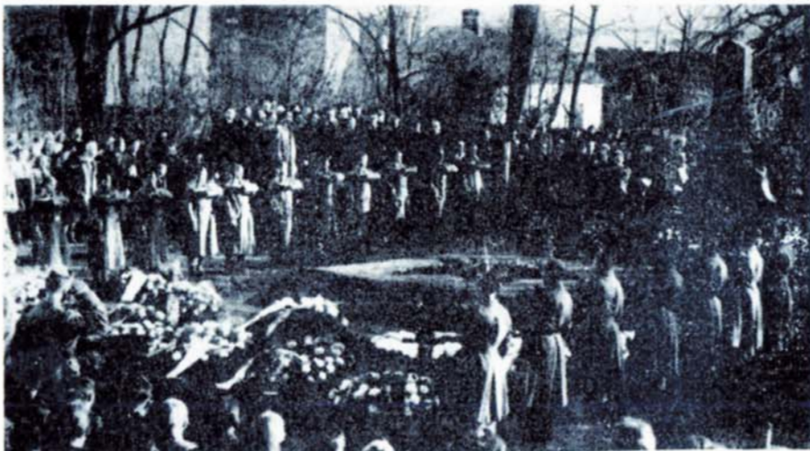
Historická fotografie z odhalování pomníku padlým vojákům při osvobození Slavkova u Brna v červnu 1945. Ve společném hrobě je pohřbeno celkem 17 vojnů, všechna jejich jména se nepodařilo dosud bohužel zjistit. Naše země přijala jejich pozůstatky s pocitů veliké vděčnosti a jejich čestnou památku každoročně obnovuje. Čest a sláva jejich památce!

Ubezpečují občany, že národní výbor, jako orgán státní moci, bude vždy dbát oprávněných a reálných zájmů občanů našeho města, a věřím, že v tomto úsilí budeme jednotní a že dosáhneme nových úspěchů a vítězství — že ubráníme mír, který je zárukou, že to, co vybudujeme, nebude válkou zničeno. To je i krédo oslav 40. výročí osvobození od fašismu.