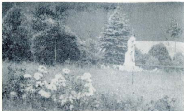
Vsypová loučka v háji vzpomínání.

Jak jsme již oznámili, chystá se ve Slavkově výstavba smuteční obřadní síně a pohřebiště. Tato zpráva vzbudila mimořádný zájem, zvláště u generace, která zestárla již v naší nové, socialistické společnosti, má pokrokové myšlení, chtěla by ale, až jednou zákonitě odejde, mít rozloučení v místě, kde žila, pracovala, radovala se, budovala v kruhu těch, kteří s ní život prožívali. Slavkov je jedním z měst na okrese, kde smuteční obřadní síň není.