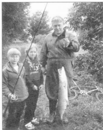
I takovou štikou ulovili místní rybáři dne 22. září při závodech lodních modelářů na rybníku ve Slavkově u Brna.