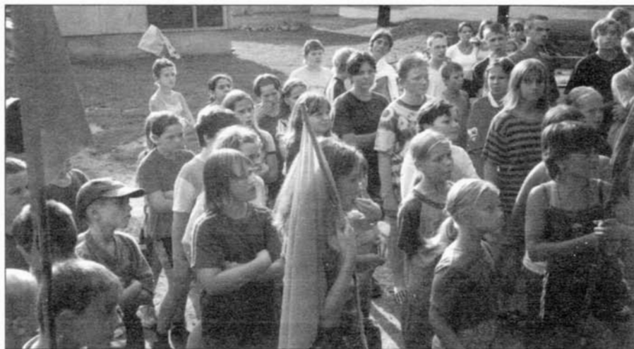
Na fotografii je ukázka z každodenního večerního nástupu 81 dětí letního tábora v Roštíně u Kroměříže. Kromě tábora zajistil DDM Slavkov v létě také zájezd pro 25 rodičů a 23 dětí do Chorvatska a basketbalové soustředění v Trhové Kamenici.