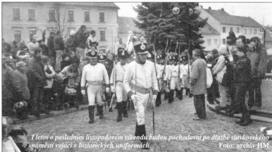
I letos o posledním listopadovém vikendu budou pochodovat po dlažbě slavkovského náměstí vojáci v historických uniformách.