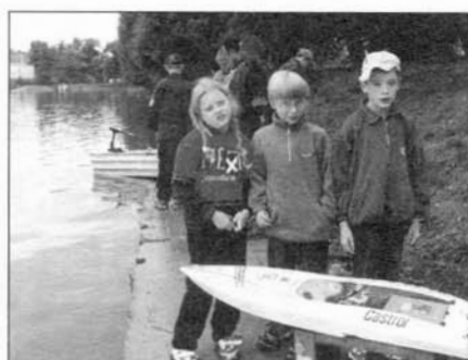
Lodní modely obdivovaly i přihlížející děti.

Přestože jsme se na stránkách Zpravodaje již v minulosti věnovali problematice nedovolených skládek, nezbyvá než konstatovat, že černé skládky jsou ve Slavkově pořád k vidění. Jedno z takovýchto míst je i u zdroje pitné vody, kam si mnozí z nás chodí pro vodu pro sebe a své děti. Jak dokládá přiložená fotografie, jsou mezi námi stále tací lidé s nedostatkem slušnosti vůči přírodě i ostatním obyvatelům Slavkova, že své nepotřebné věci a odpady (v tomto případě blatníky z automobilu) odkládají, kde se jim zlíbí. Paradoxem je, že sběrný dvůr, kam by tyto věci mohli dát, je vzdálen od této černé skládky jen několik kroků. Slavkovský zpravodaj by však chtěl poděkovat těm, kterým není vzhled našeho města lhostejný a za sobecké občany tyto odpady trpělivě uklízí. (zn)