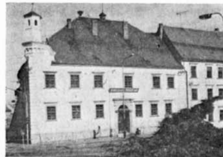
RADNICE — Palackého nám. č. 64, renesanční budova z roku 1592

Památník bitvy u Slavkova na svahu „Pod Urbánkem“, prostý zděný památník z počátku 19. století, zbudovaný na paměť slavkovské bitvy.