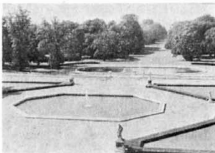
Zámecký park, obnovený v roce 1977

Z nejdůležitějších a nejcenějších památek města Slavkova je státní zámek, charakteristická silueta města, pozoruhodný komplex budov barokního zámku z konce 17. a začátku 18. století. Je nejvýznamnější místní památkou celostátního dosahu.