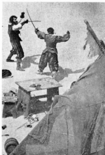
Z vystoupení skupiny historického šermu LAG v prostorách zámeckého parku.