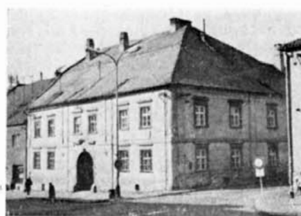
PANSKÝ DŮM — renesanční budova ze 16. století

Další významnou památkou v těsné blízkosti zámku je zámecký park, rekonstruovaný v letech 1972-1977, cenný doklad vývoje zahradní architektury. Původní park vybudovaný v roce 1774 byl ve výše uvedených letech dle nového architektonického návrhu podnikem SÚRPMO Praha, pracoviště Brno, přetvořen. Podle tvarů původních bazénů byly vybudovány čtyři