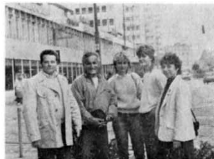
Ještě snímek z ložské návštěvy košíkářek v polské Poznani.

Přinášíme též záběry z prací na pokládání nového umělého povrchu na druhý volejbalový kurt. Umělý povrch obou hřišť, který sloužil téměř 12 let, doznal již tak rozsáhlého opotřebení, že bylo nutno dobré části povrchu jednoho hřiště přenést na druhé, aby alespoň jedno bylo v provozuschopném stavu. Bylo třeba tedy snést betonový, původní základ hřiště č. 2, položit jednotlivé nové betonové podklad a opatřit jej zvláštním nátěrem. Hřiště bylo tak připraveno pro položení nového povrchu. Tyto práce byly provedeny již ve druhé polovině roku 1987. Po zdoluhavém, ale přece jen úspěšném jednání dodal podnik NISASPORT Jablonec jednotlivé části umělé krytiny, která byla ještě před položením složena do velkých čtverců a připravena k vlastnímu položení na plochu. Pod dohledem techniků NISASPORTU byly jednotlivé části položeny a složeny v jednotlivý elastický koberec v pěkném barevném rozlišení hrací plochy (červeně), čáry (bílé) a okrajové zázemí (zeleně). Celá plocha působí velmi pěkným a estetickým dojmem.