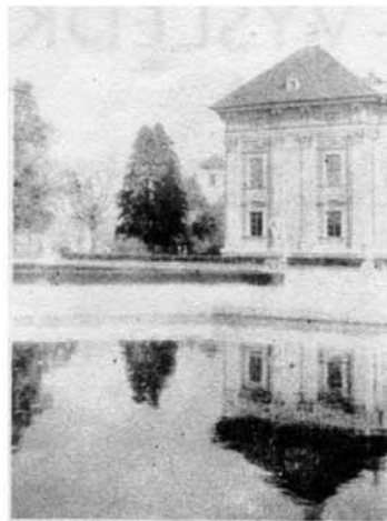
Podzimní nálada na zámku ve Slavkově.