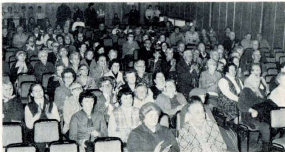
„Slavkovské děti hrají, tančí a zpívají našim důchodcům“

Takový byl název pořadu, který na 19. března 1984 připravil Sbor pro občanské záležitosti pro důchodce ze Slavkova i z Vážan. Slavnostní odpoledne bylo díky slavkovských dětí za klidný a mírový život, který pro ně vybudovali.