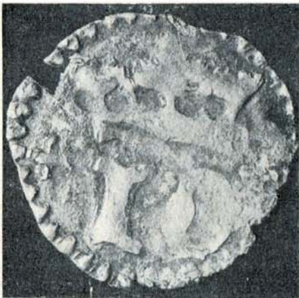
Mince markraběte Jošta s písmeny IO

míli široko (t. j. asi 10 km) plenila a ničila všechna sídlíště.