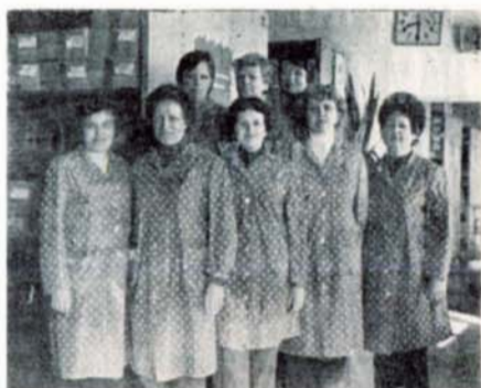
Kolektiv BSP s. Chalupové, Textil a oděvy