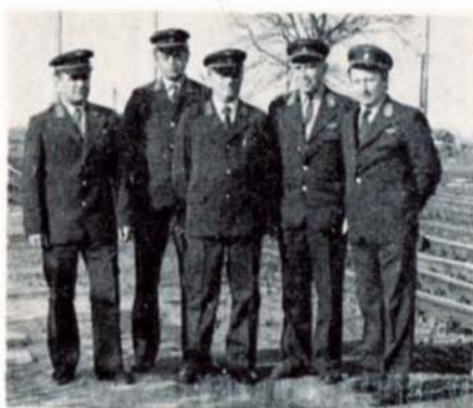
Kolektiv signalistů ČSD Slavkov