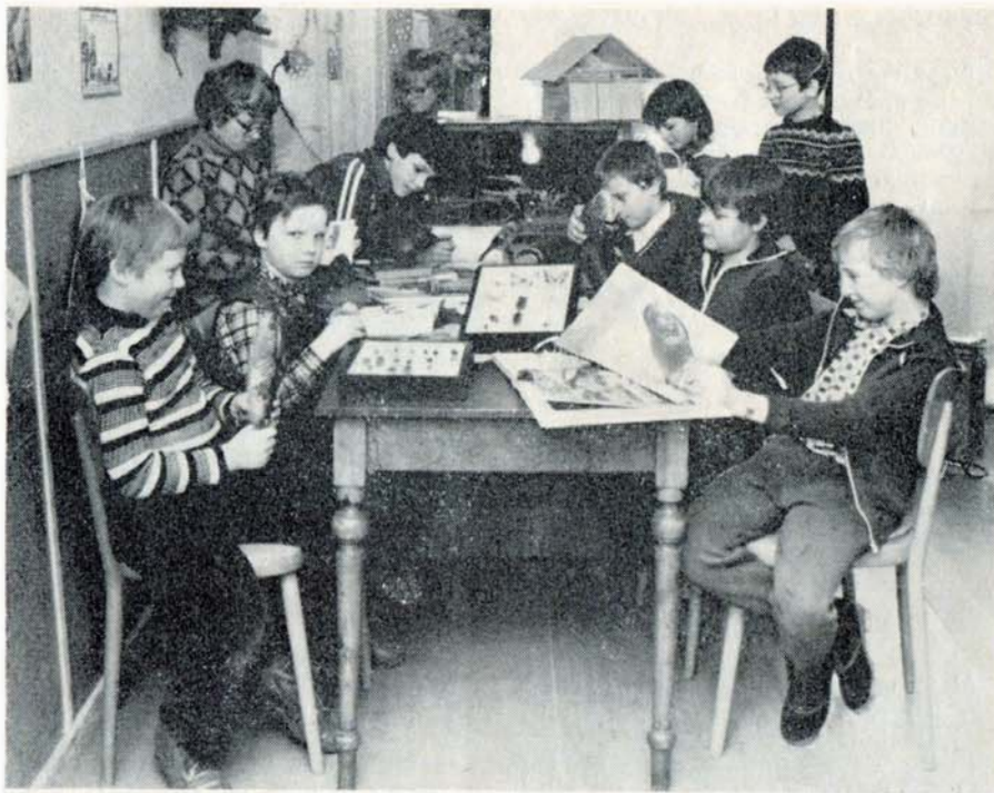
Klubovna mladých ochránců přírody na Kolářkově náměstí