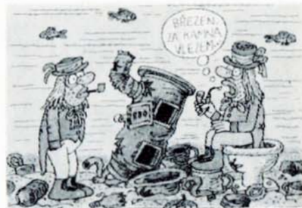
U kamen, hozených do rybníka, se zahřejí jedině vodníci ...

Pamatujte na to každý den. Je to jedna z morálních povinností občanů každého věku až do pozdního stáří!