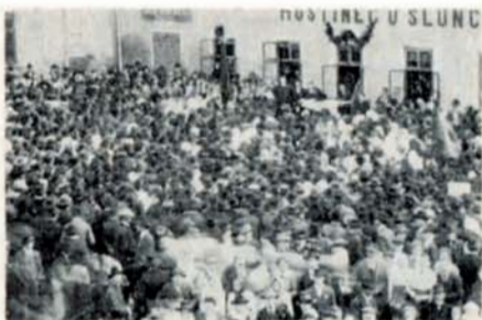
Slavnostně se slavil První máj také v roce 1920, kdy se na manifestaci sešli masově občané města i okolí

náměstí, Cutisin dokončil přestavbu kotelny a připravuje plynofikaci, Agra dokončila administrativní budovu a úpravy v areálu, ZOU zahájilo přístavbu učeben v Tyršově ulici, učiliště ČSVD nezahájilo výstavbu nové školy, ve Vážanech n. L.: byla provedena komunikace v ulici ke Kunderovému, pro opravu kulturního domu je vypracována studie, není dořešena noclehárna pro fidiče ČSAD.