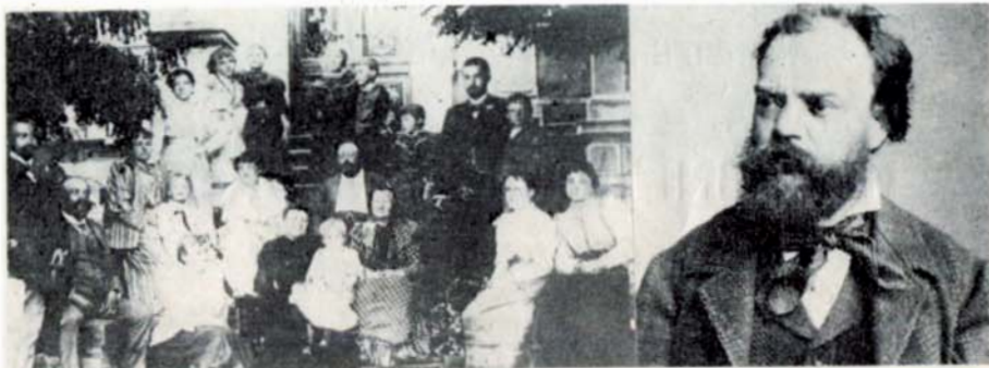
Rodina Dvořáková a Kaunicova a fotografie Antonína Dvořáka