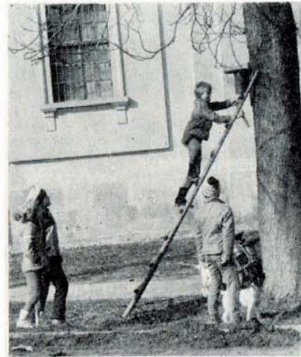
Mladí ochránci přírody vyvěšují budky pro ptactvo

A my doplňujeme o výzvu: pošlete své dítě do tohoto kroužku! Znáť, milovat a pečovat o přírodu je nejen první krok k ušlechtilému charakteru, ale i reálnému pohledu na svět. To je první podmínka k plnému uplatnění v životě!