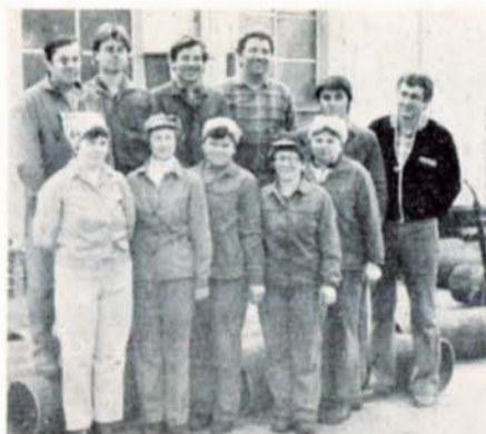
Kolektiv BSP s. Dobeše, obrobna Agra