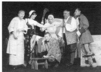
Divadelní společnost Josefa Dvořáka s úspěchem uvedla ve Slavkově hru norského autora Jeppe řádí.

Na Vaši návštěvu se těší pracovníci naší kanceláře