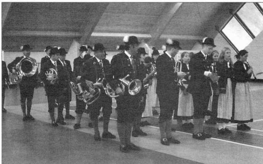
Dechová kapela v typických rakouských krojích z družebního města Hornu.