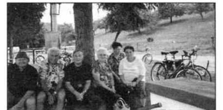
Cílem našich výletů je i Jalový dvůr.