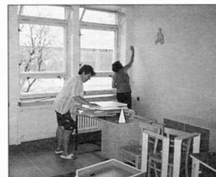
Vychovatelky se snažily, aby se dětem v rekonstruované družině líbilo.