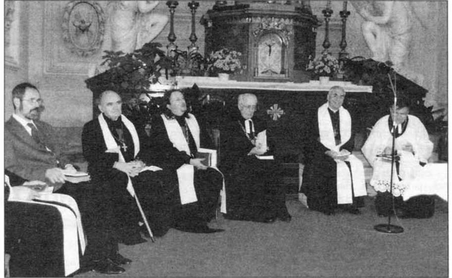
Účastníci setkání Dnů smíření v rámci Slavkovské iniciativy smíření v místním Chrámu Vzkříšení Páně.

Na tomto místě bychom rádi poděkovali všem občanům, jimž není jejich město lhostejné a často se na nás obraceli s nejrůznějšími př-