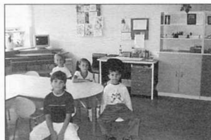
Děti v novém prostředí družiny.