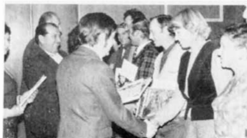
Předávání čestných uznání poslancům MěNV