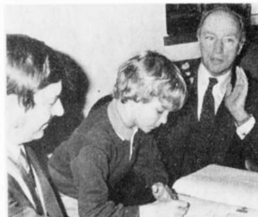
Na snímcích se slavnostně zapisují do pamětní knihy města Pierre Elliott Trudeau a jeho syn Sacha.