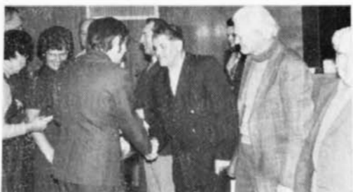
Předávání čestných uznání stavební četě