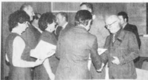
Předávání čestných uznání zástupcům organizací Národní fronty