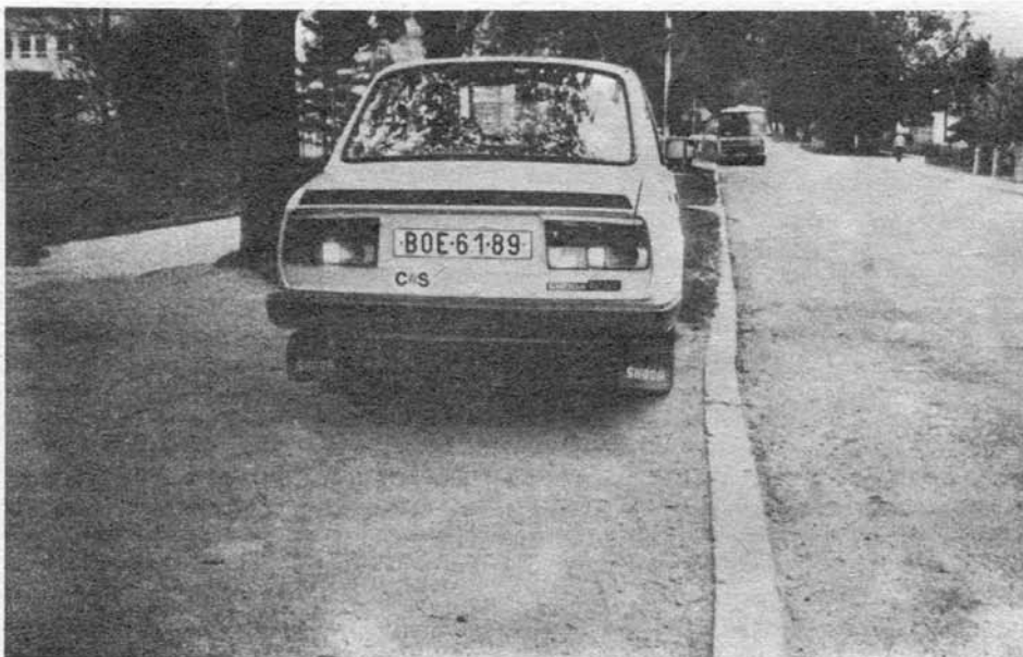
Komentář jistě není třeba