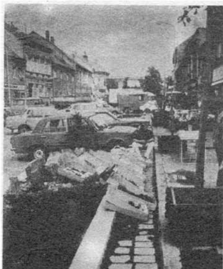
„Prosím, pro moje krabice se suchou vazbou je nejlepším pozadím městská zeleň“