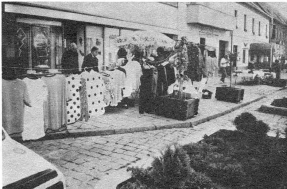
Stačí šňůra na prádlo a obchodní dům na chodníku je hotov

Krátce jsme se zabývali odesílatelem a adresátem notej proti stánkovému prodeji na slavkovském náměstí. Pohledů může být a je pochopitelně více. Nyní jsem si vybral ten, který jednoznačně hovoří o tom, že stánkaři by měli ze středu města