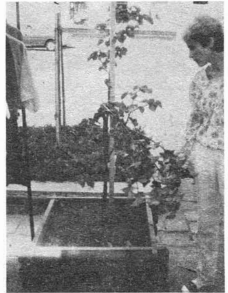
Paní vedoucí z cukrárny se nestačila divit. Lipka nevydržela zátěž šňůroprádelního regálu

Obecním i městským úřadům se dostává stále více pravomocí. Je to správné a potřebné. Na případu