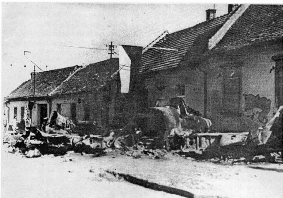
Na našem snímku z posledních dnů války vidíte sestřelené letadlo v Bučovické ulici.

Boj o Slavkov začal v časných ranních hodinách. Sovětská armáda ostřelovala hitlerovské pozice na okraji města. Dopoledne byli na Kozích horách spatřeni první sovětské vojáky. Palba byla přenesena do města a za město směrem na Bučovice. Německé vojsko hájilo každou křížovatku, zátaras byly zajišťovány střelbou z děl a obrněných transportérů, do boje byla nasazena německá samohybná děla typu „Ferdinand“. Několik protiztečí obrněných