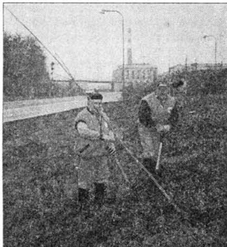
Zaměstnanci Technických služeb vysazují mladé stromky kolem rybníka.

TS v době vegetačního klidu 97/98 vysázely zatím víc jak 300 stromů. Z toho například 153 listnatých stromů do prostoru rybníka. R. Lánský, ředitel TS