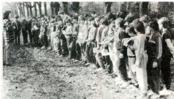
Sportovně-branná soutěž "O štít Vítězného února".

Oblibu si získala sportovně-branná soutěž o putovní pohár MDPM. Ten získala na jeden rok do svého držení za vítězství ZŠ Komenského.