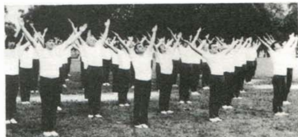
Vzpomínka na ČSS 1985 - okřsková spartakiáda ve Slavkově. Skladba mužů bude patřit opět k nejlepším i v roce 1990.

Na slavnostním aktu byli přítomni zástupce krajského spartakiádního štábu v Brně a tajemník Krajské odborové rady soudruh Purkert a představitelé stranických a státních orgánů města.