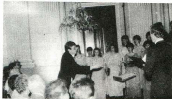
Koncert Brněnské akademického sboru konaný 8. září 1989 v Historickém sále.

Komorní soubory brněnské agentury účinkovaly ve Slavkově téměř všechny a jejich koncerty patří k těm nejúspěšnějším.