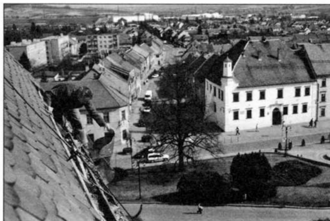
Snímek z březnových oprav okapů na slavkovském zámku.