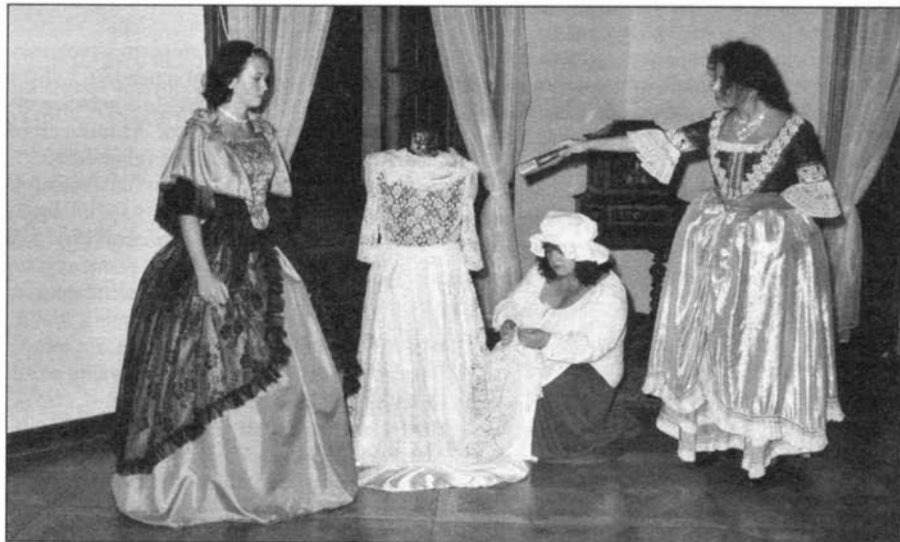
V sobotu 18. května mohou návštěvníci slavkovského zámku zhlédnout netradiční večerní prohlídky, při kterých uvidí, co všechno prožívají záměční páni i služebnictvo, když končí den a začíná noc.

Pozvánka Redakční uzávěrka pro předání podkladů do příštího čísla je 20. května. Přednostně budou zařazeny články o rozsahu do půl strany formátu A4 psané psacím strojem. U delších příspěvků se pisatel vystavuje možnosti zkrácení, popř. i nezařazení svého článku. Vítejte články dodané na disketě nebo zaslané e-mailem. (red)