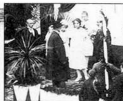
Prezident T. G. Masaryk před slavkovskou radnicí (u vchodu v dlouhém kabátě – viz detail vpravo nahoře).