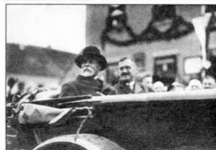
Tomáš G. Masaryk projíždí náměstím.