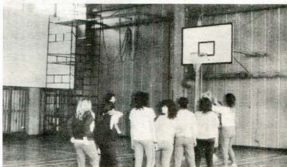
rohled do nové tělocvičny.

V roce 1989 jsme realizovali následující investiční stavební akce. Dokončili jsme kolaudaci tělocvičnu s dodržením rozpočtových nákladů celkem 3,768.000,- Kčs včetně úspory pro úpravu jejího okolí. Tělocvičnu využíváme pro výuku předmětů tělesná výchova a sportovní hry spolu s SOU Slavkov, Čelakovského. Kromě toho každý den odpoledně v ní probíhá činnost většiny našich zájmových kroužků v rámci mimoškolní výchovy. Od ledna 1990 navrhujeme TJ Slavoj Slavkov pro činnost oddílů volejbalu, badmintonu, atletiky bezplatně 15 hodin týdně a možnost sehrání mistrovských zápasů oddílů volejbalu a badmintonu. Dále jsme začali a dokončili výstavbu plynové přípojky s rozpočtovými náklady 527 tis. Kčs jako předpokladu plynofikace nejen naší kotelny, ale i části města Slavkova. Pokračovali jsme v pracích na přístavbě budovy školy, kde jsou celkové rozpočtové náklady 5,389.000,- Kčs.