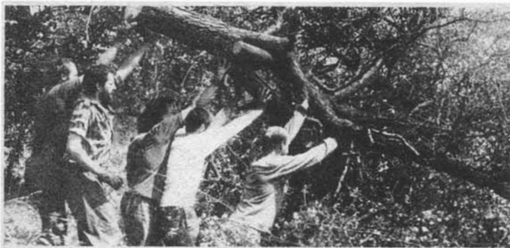
Ochranáři v akci.