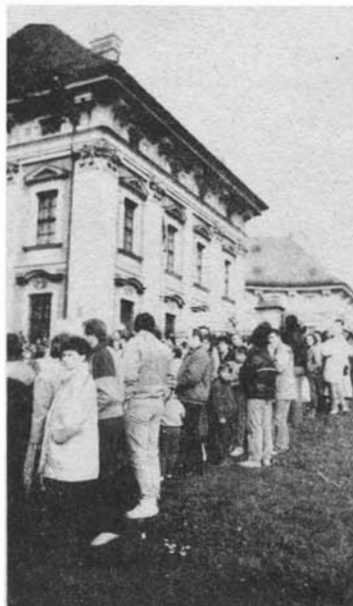
Slavkov očekává vzácnou