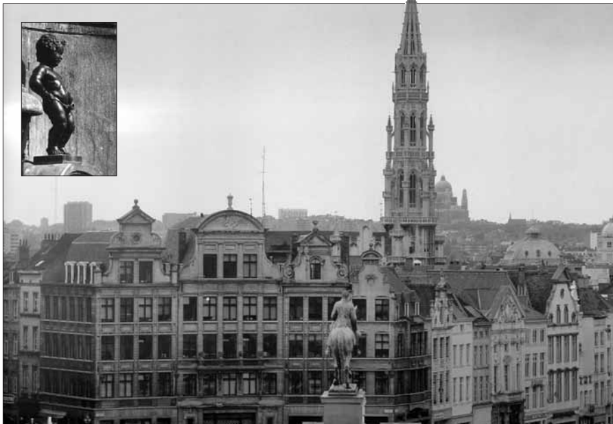
Brusel – hlavní město Evropy – byl cílem služební cesty zástupců našeho města. Na snímku je památková věž radnice (vysoká 90 m) a nahoře je Manneken pis – symbol města