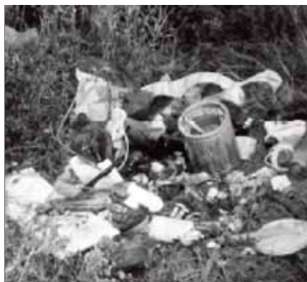
Důsledky „likvidace“ tuhých odpadů v podání některých občanů

Přípomínky a návrhy pak mohou být předány písemně v podatelně MěÚ, nebo prostřednictvím zastupitelů přímo na zasedání městského zastupitelstva. Věra Křivánková