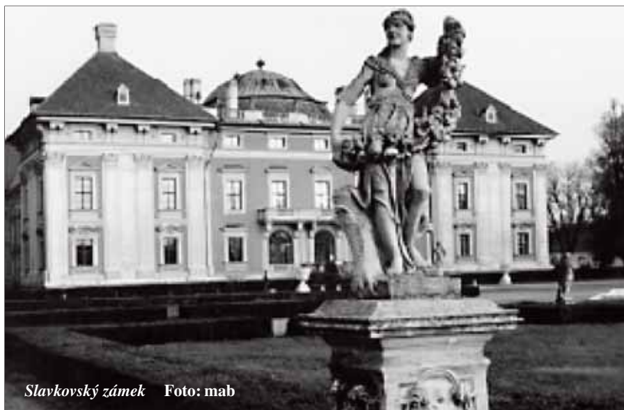
Slavkovský zámek