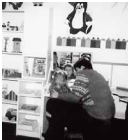
Logopedická třída MŠ