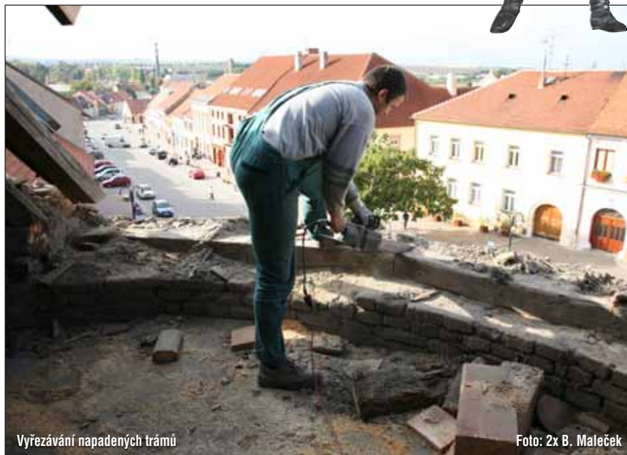
Vyřezávání napadených trámů