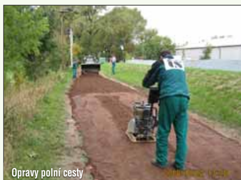
opravy polní cesty

átěnové redakční rady vykonávají práci pro zpravodaj ve svém volném čase a bezplatně.