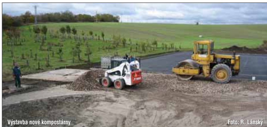
Výstavba nové kompostárny