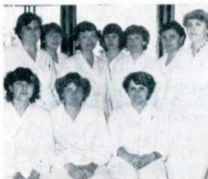
BSP oblastní zemědělské laboratoře ACHP se sídlem ve Vyškově