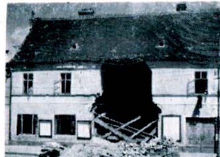
Snímky domů na náměstí, poškozených v boji o město.