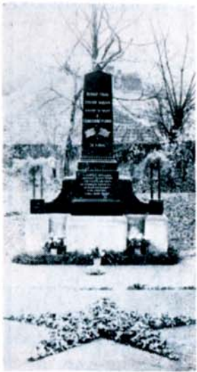
Pomník padlým rudoarmejcům