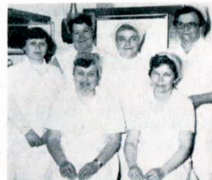
BSP správních zaměstnanců MŠ Malnovského, Slavkov