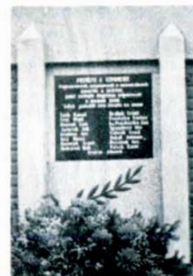
Deska popravených a umučených na hřbitovní zdi.