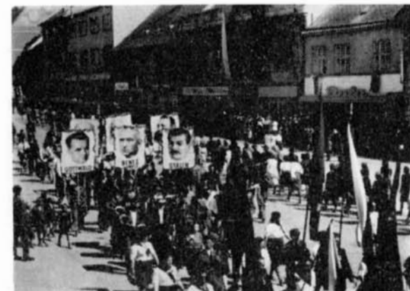
Pohled na část komunistického průvodu na 1. máje 1947.