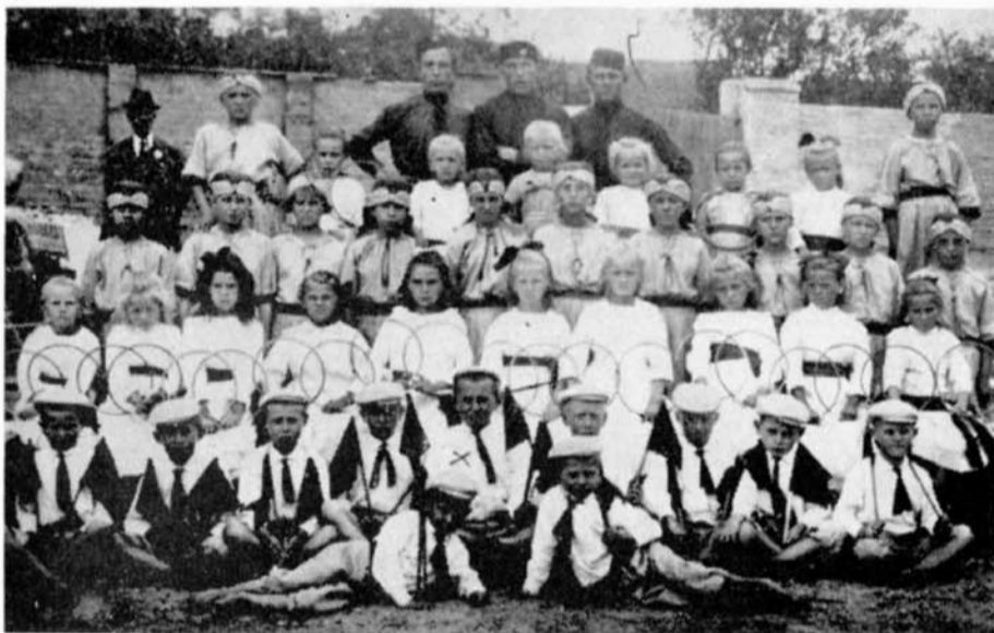
Snímek ukazuje mládež před veřejným cvičením FDTJ v Hruškách v roce 1922. Je vidět, že o „drobtinu“ neměly tehdy FDTJ nouzi.