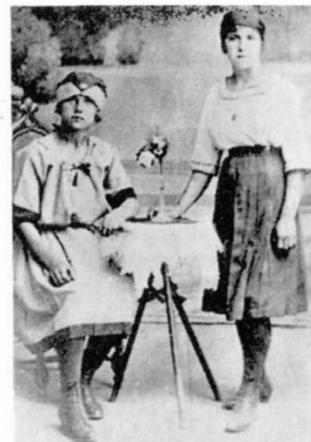
Kroje mužů, žen a dorostenek.