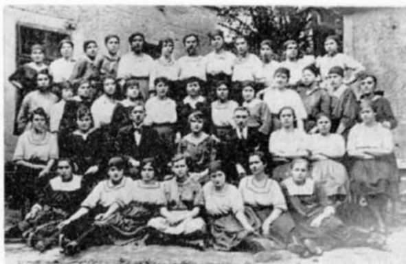
Členky FDTJ na cvičitelském kursu XX. okresu — rousínovský okres.

Končíme tuto kapitolu dějin strany a jejího vítězného vybojování cesty k socialismu. Otázky budování socialismu jsou pak předmětem dalšího zpracování. I zde, jako od počátku hnutí, se strana nevyhnula nedostatkům, omylům, ale dosáhla také velkých vítězství, o kterých se jim v minulosti ani nesnilo.