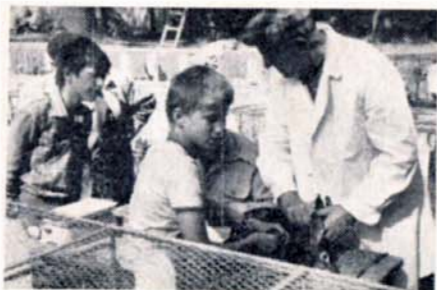
Mladí chovatelé při posuzování králíků

bylo vyprodukováno jak členy, tak i nečleny svazu chovatelů, ale co je důležitější je to, že krmivo pro tyto králíky bylo získáno z nedostupných ploch pro mechanizovanou sklizeň. Mimo králíčího masa vyprodukovali chovatelé 7 192 ks násadových vajčiček pro líheň, v domácnostech formou samozásobení spotřebovali 34 259 ks vajčiček, 100 kg drůbežího masa, 40 kg kachního masa, 62 kg holubího masa a ostatní produkty doma vypěstované. Mimo to dodali zpracovatelskému průmyslu 1 293 ks králíčích kožek, 38 kg angorské srsti, 101 ks kožek nutrií, do dalšího chovu odprodali chovná zvířata, a to vše i s odpracovanými brigádníckými hodinami tvoří hodnotu díla v částce 231 965 Kčs, a to je 5 154 Kčs na jednoho člena.