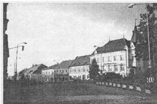
Bonapart ještě v dobách záře podzimního slunce

Úředním dnem bude i sobota 25. března 1995, a to od 8 do 12 hod.